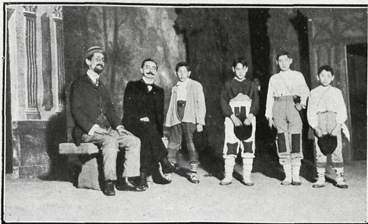
Escena segunda de la obra. El alcalde del pueblo y D. Martín, el maestro, examinando de castellano a los chicos por el sistema Berliz.

Pocas veces ha logrado un éxito tan grande en Martín obra alguna. Al de La hermana Piedad ha contribuido en no poco la interpretación, que fué acertadísima.