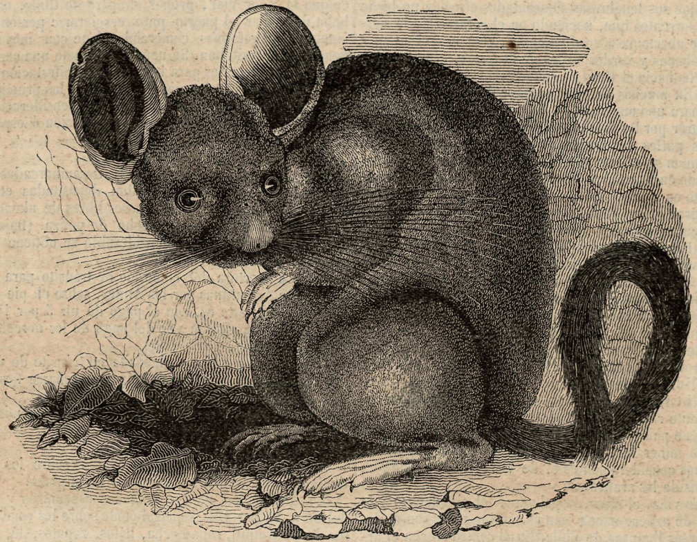
La chinchilla de Chile.