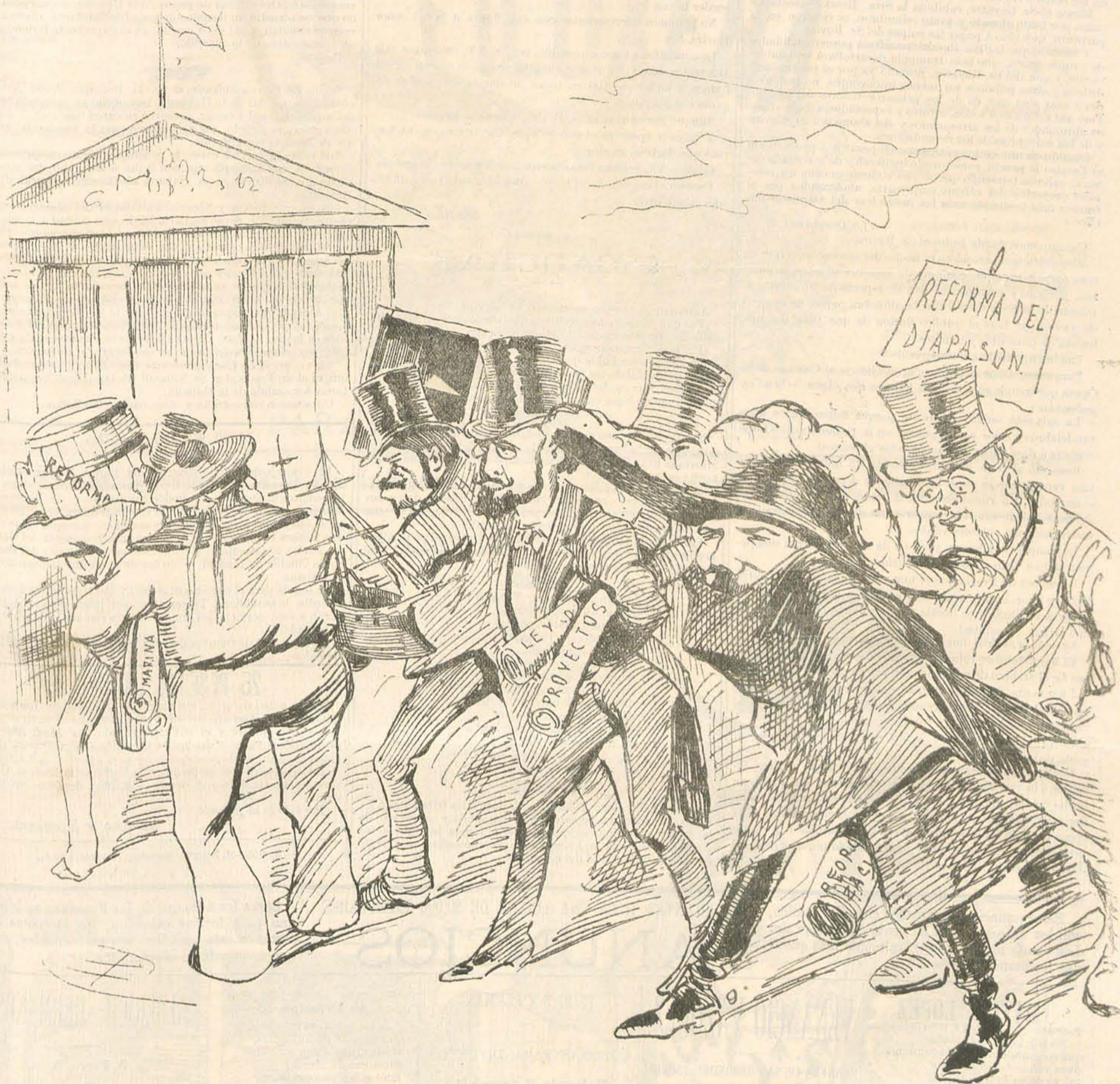
Los contrarios y los fieles acuden en peloton. (El resto de la función se anunciará por carteles.)

teatro de la Opera, á cargo hoy del celeberrimo empresario Sr. Rovira.