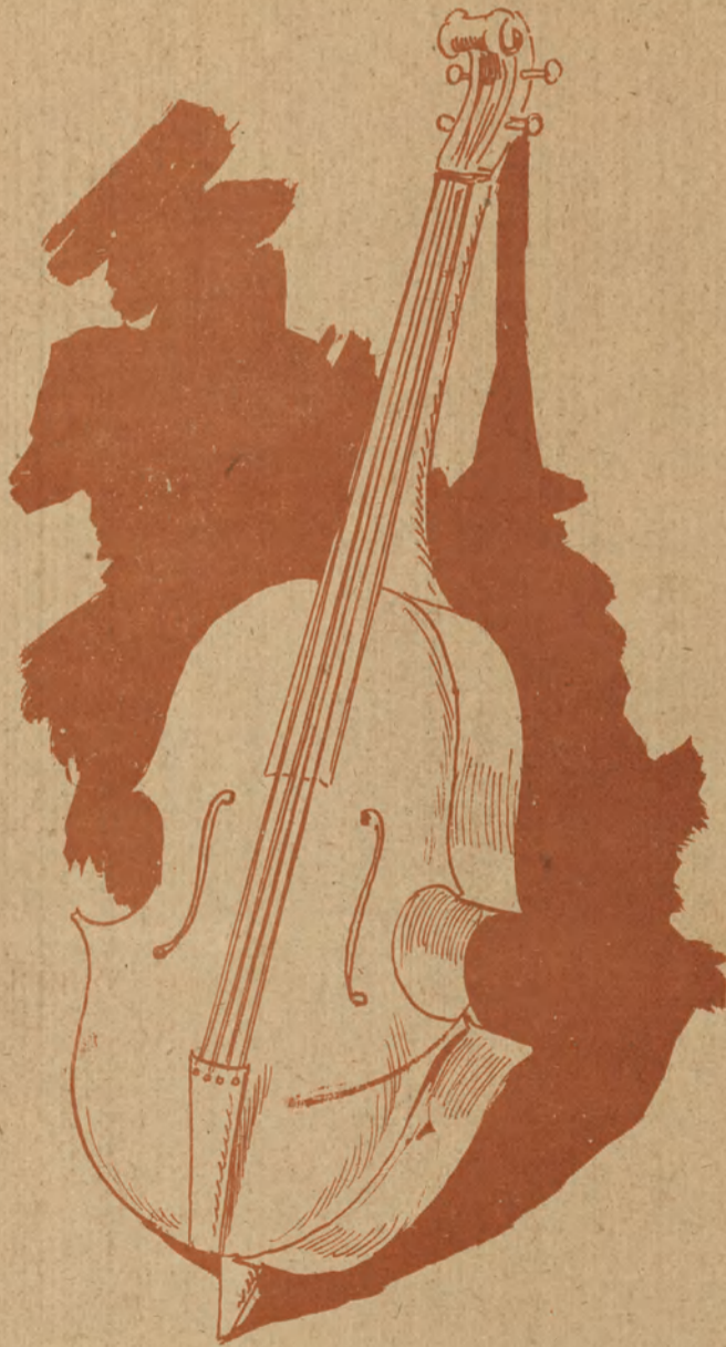
El único instrumento que ha quedado á disposición de la empresa del Real.