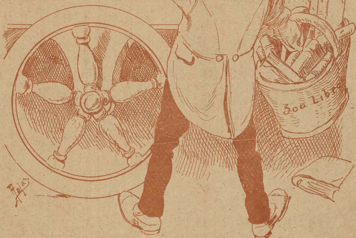
El monstruo disponiéndose á devorar los trescientos libros.

Una recomendación á la señorita Brú. En el último cuadro no debe dirigirse á los espectadores. El papel exige que dé cara al foro. Produce mal efecto este descuido ó lo que sea.