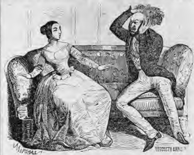
Dios negociaciones; desde aquella fecha tuvo don Dieguito que hacer renuncia forzosa á la mano de Tomasita y á la herencia de Camposoco.

En cambio las pelucas tienen tambien sus desventajas. Un descuido puede producir facilmente una seria ruptura en las relaciones mejor entabladas y sostenidas, especialmente en negociaciones amorosas. Tres años llevaba mi amigo don Dieguito de decretido galante y estrecha intimidad con Tomasita, la heredera presunta del conde de Camposoco. Las negociaciones iban tocando á un desenlace feliz. Pero una mañana de verano, hallándose en sabroso coloquio los dos amantes, antojósele á una atrevida pulga introducirse entre el cráneo y la peluca de mi amigo: sintió este la incomodidad de la picazon, y por un movimiento primo-primo que dicen los moralistas, de estos movimientos que no se premeditan por ser tan naturales, llevó súbitamente la mano á la cabeza, dirigió los dedos en busca del punzante insecto via recta del sitio picado, levantó la peluca, advirtiéndole Tomasita que hasta entonces ni siquiera habia sospechado que no fuese cabello natural, miróle con sorpresa, dióle un vuelco el corazón... y á