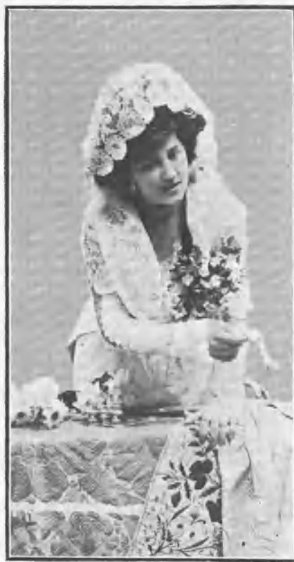
Correspondiendo al brindis.