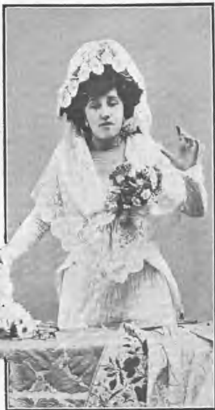
Impresión de una cogida.