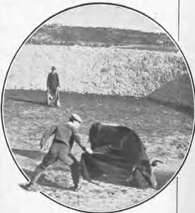
«Machaquito» toreando de muleta.