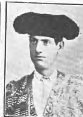
Manuel Rodríguez (Manolete)