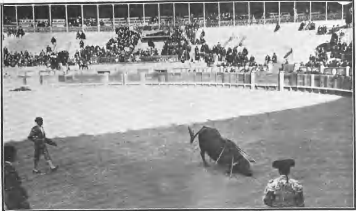
Punteret viendo doblar á su primer toro.