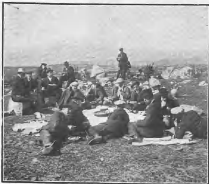
Comedor al aire libre.

Los expedicionarios regresaron á Madrid satisfechísimos y deseando que se repitan con frecuencia estas hermosas fiestas campestres.