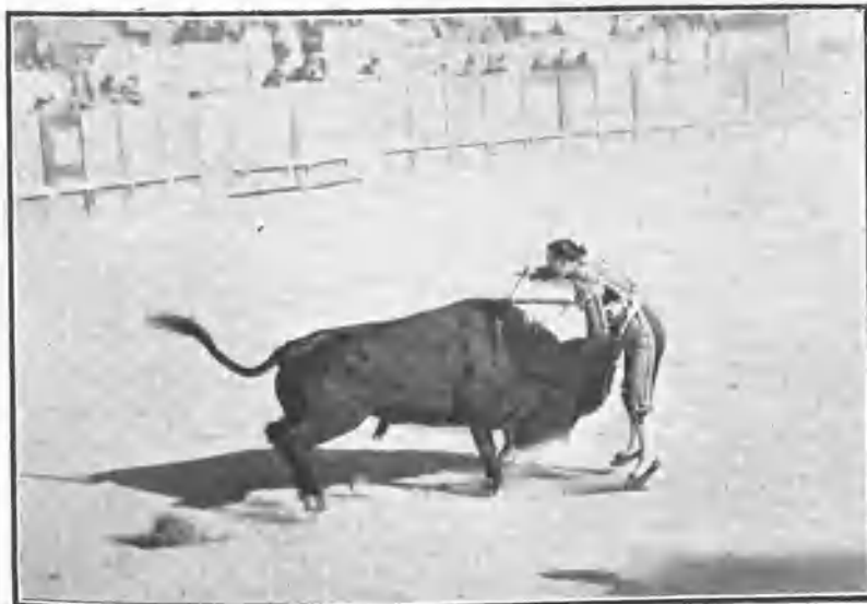
Pacomio matando su segundo toro.

Estos abusos deben cortarse radicalmente, pues lo contrario es fomentar la manía suicida y hacerse reo de una complicidad que por igual alcanza á cuantos de algún modo la favorecen.