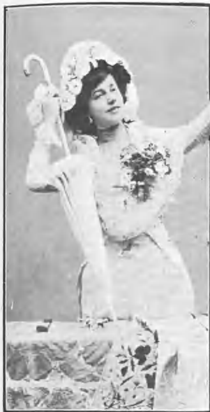
Haciendo la señal.

Una de las notas más simpáticas que tienen las fiestas de toros, especialmente aquellas que son patrocinadas por Sociedades ó Juntas de damas, es la de las señoritas que presiden.