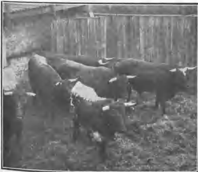
Una corrida apartada.