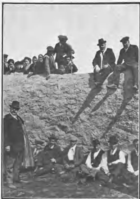
Antes de la salida del toro.