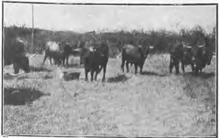
Toros de Conradi.