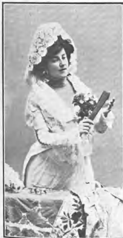
Palmas al diestro.