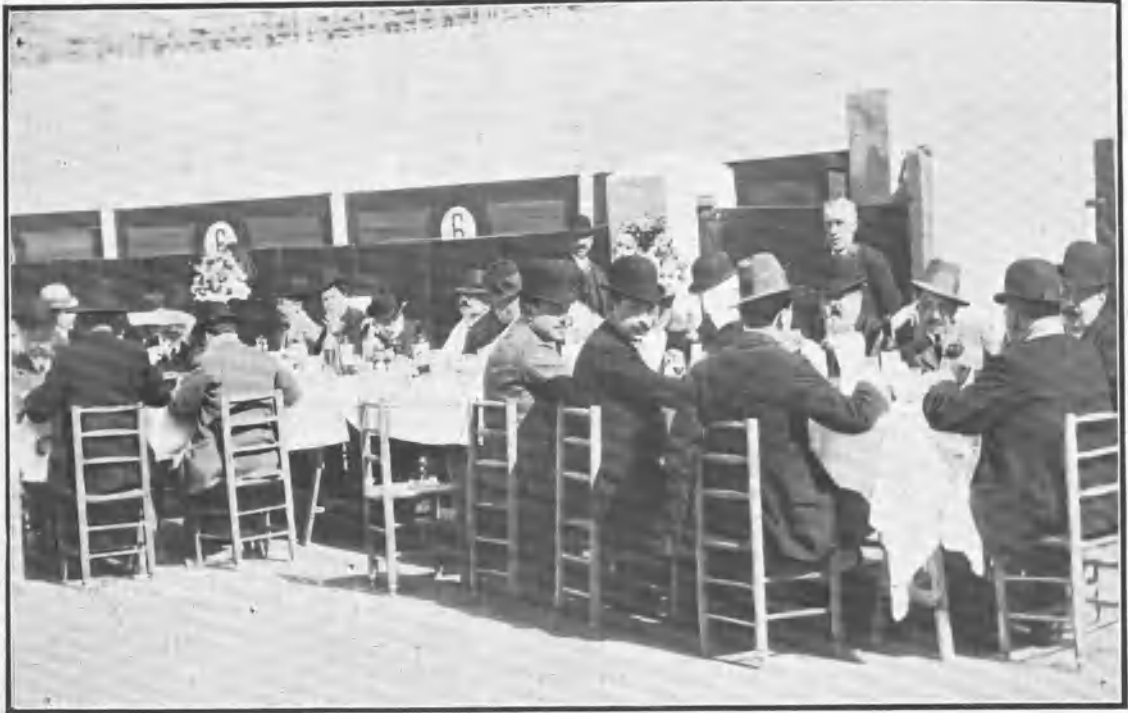
Banquete en la plaza.

La empresa de la plaza de Vista-Alegre (Carabanchel) celebró el día 17 una agradabilísima fiesta de esas que no se olvidan.