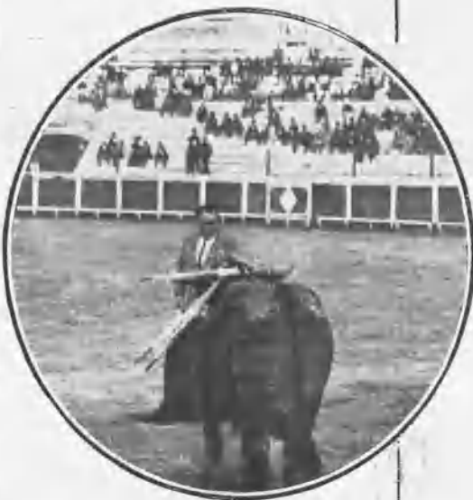
«Corchaito» igualando un toro.

En cambio, en el cuarto estuvo colosal, porque además de colocar cuatro pares de banderillas inmejorables, hizo una faena de mule-