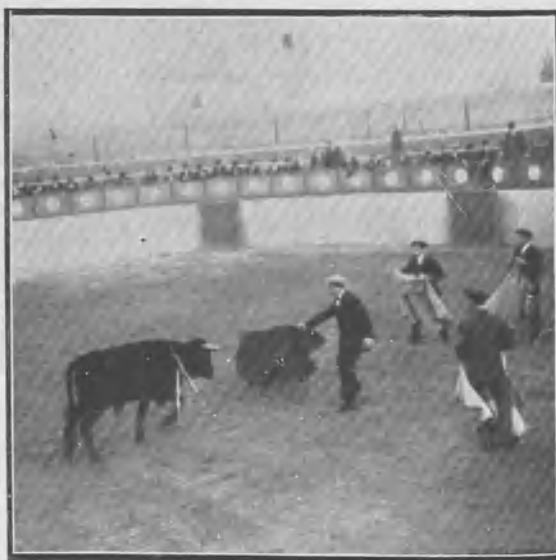
EL PRIMER ESPADA PASANDO DE MULBTA