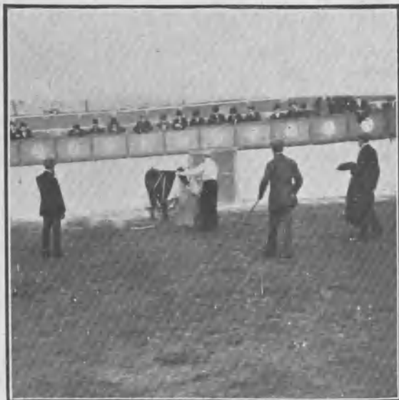
PREPARANDO EL TORO PARA BANDERILLAS

En suma, que se divirtieron los diestros sin que ocurriera nada desagradable, y también pasaron un buen rato los invitados, quienes agradecieron el buen rato que les proporcionaron los alumnos.