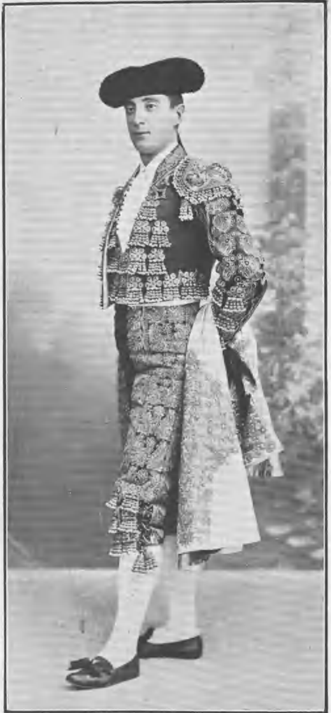
CÁSTOR IBARRA (COCHERITO DE BILBAO)