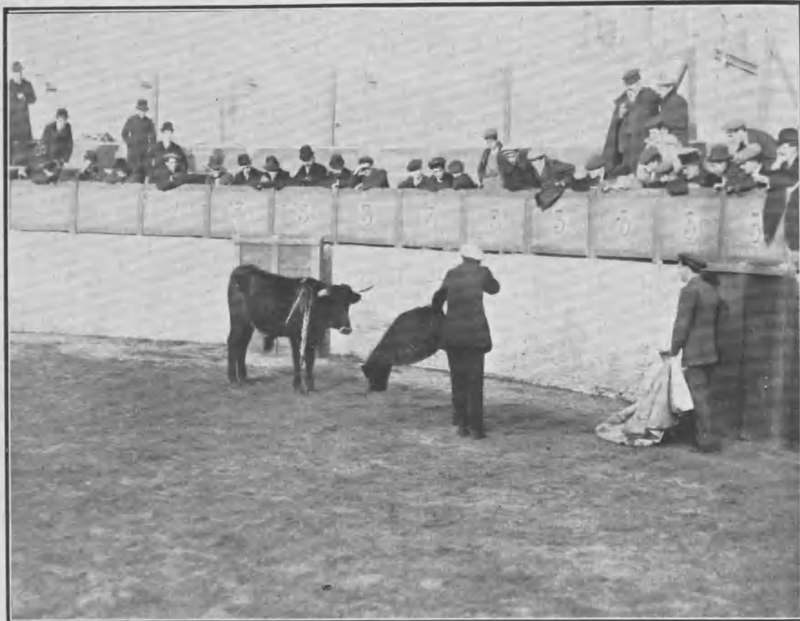
EL PRIMER ESPADA ENTRANDO Á MATAR