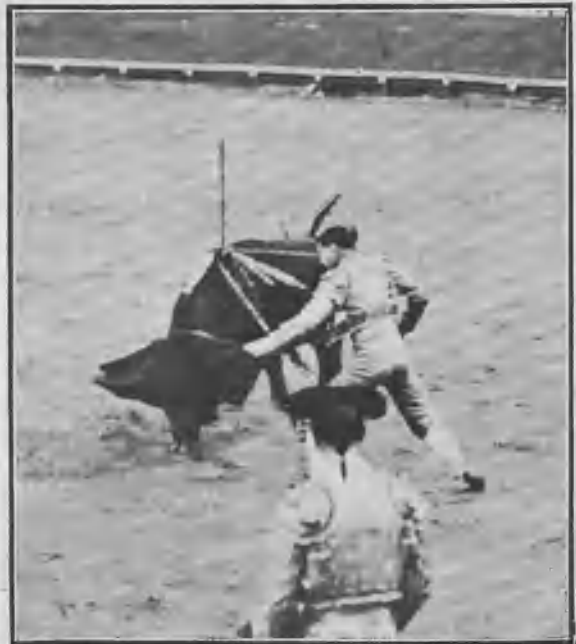
MANOLETE TOREANDO DE MULETA A SU PRIMER TORO

El público aplaudió entusiasmado los lances que ejecutaron uno y otro, y particularmente el bilbaino ganó un formidable cartel, echando la base para formar entre aquellos aficionados una