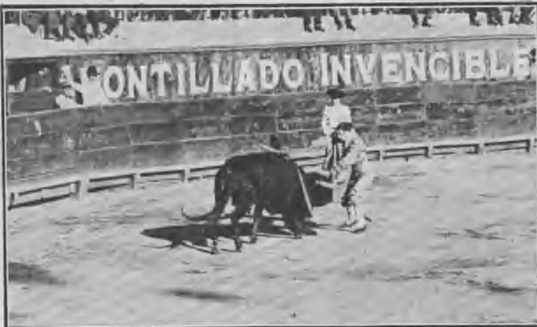
MANOLETE ENTRANDO A MATAR