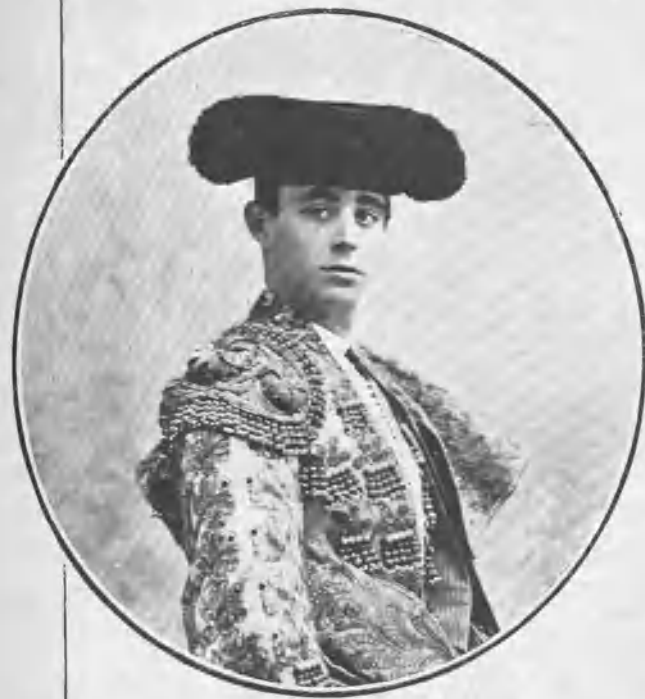
RAFAEL GONZÁLEZ (MACHAQUITO)

Su nombre como estoqueador ha llegado á una gran altura y haría mal en perder el honroso puesto que ha ganado á fuerza de puños.