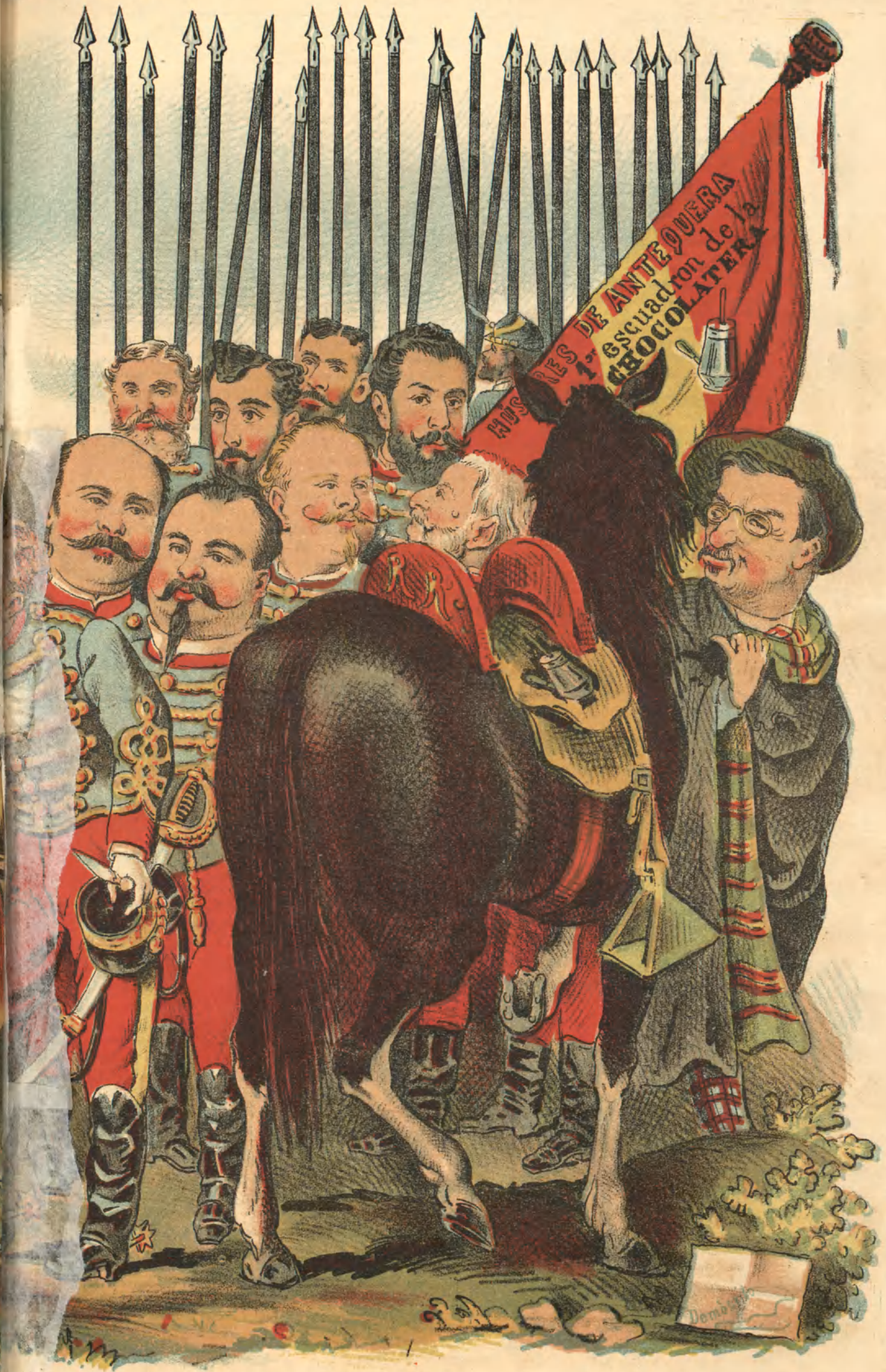
LAZQUEZ TITULADO LA RENDICION DE BRED A.)