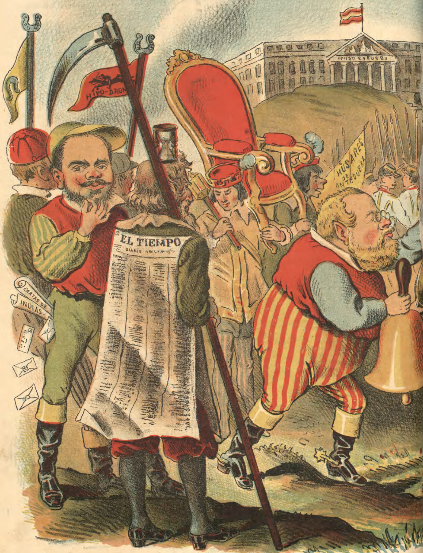
LA RENDICION DE TORENO. (PARODIA DEL CUADRO