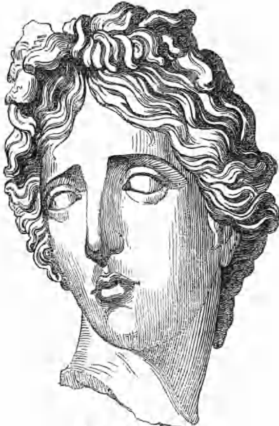
Antigua testa de Apolo.

Si se atiende á la inflexion y á lo torcido del cuello, dice Mr. Panofka, no menos que á la direccion de los ojos, es licito afirmar que la estatua estaba sentada. Su pérdida es tanto mas sensible, cuanto que la cabeza es de un estilo muy poco comun entre los numerosos monumentos que del arte griego conservamos, sin que por eso sea mas fácil el asignar la época á que pertenece. Con menos trabajo podremos reconocer en ella la nobleza de la expresion, la grandiosidad, la magestad de la fisonomia, y la habilidad del cincel que la dió un carácter á la vez original y bello. Los cabellos conservan evidentes restos de coloracion, lo que nos hace presumir que el tiempo ha borrado un colorido ligero y fugitivo que habria sido aplicado sobre sus carnes; así es que si el escultor ha dado un carácter tan pronunciado á las cejas y á los grandes contornos, debemos creer que el color dulcificaba los ángulos, y modificaba los diferentes planos por medio de una capa blanquizca, cuyo tono y espesor corregiria la aspereza del cincel.