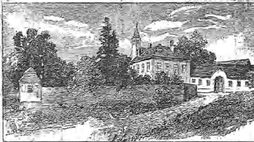
El castillo de Meyerling, donde ha muerto el príncipe Rodolfo.

En la imposibilidad de estudiar aquí, como quisiera, cada uno de los actos y números de Los Amantes de Teruel , habré de conformarme con citar sólo el hermoso prólogo, que profetiza las bellezas de todo lo que sigue; el dúo del acto tercero, donde después de los apasionados reproches de Marsilla, y de los tristísimos acentos de Isabel, se escucha la despedida del infeliz amante, en frase acertadísima, llena de la tristeza y sublime amargura de quien prevé su próxima muerte; el último acto, su fin,