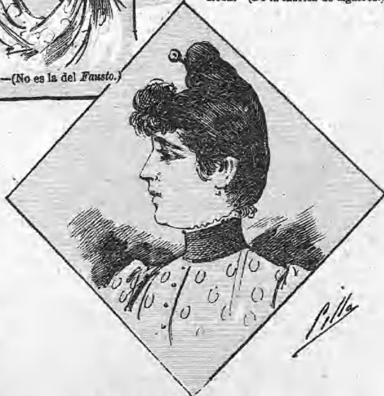
AZUCENA.—(De origen salmantino.) Se adjudicarán los premios por sufragio directo de nuestros suscritores.