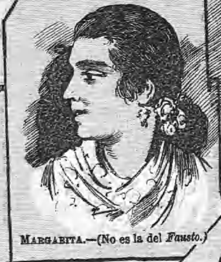
MARGARITA.—(No es la del Fausto.)