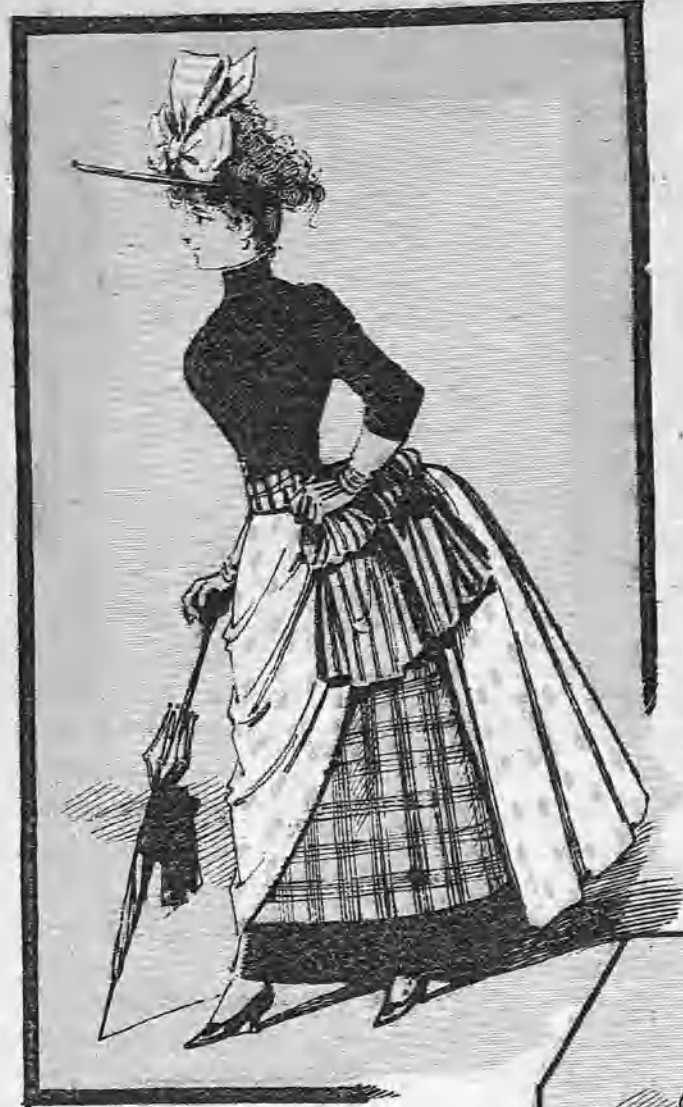
HORTENSIA.—(Del Jardín Botánico.)