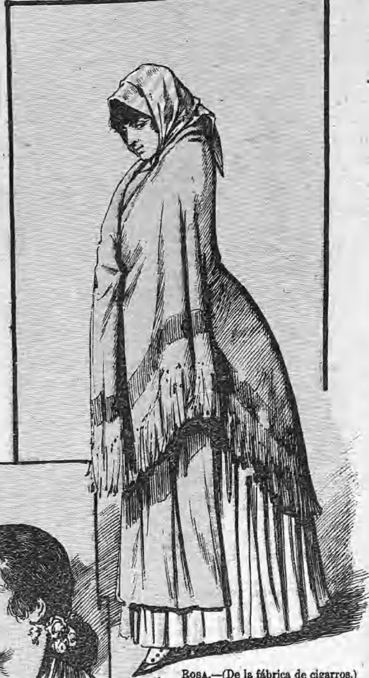
ROSA.—(De la fábrica de cigarros.)