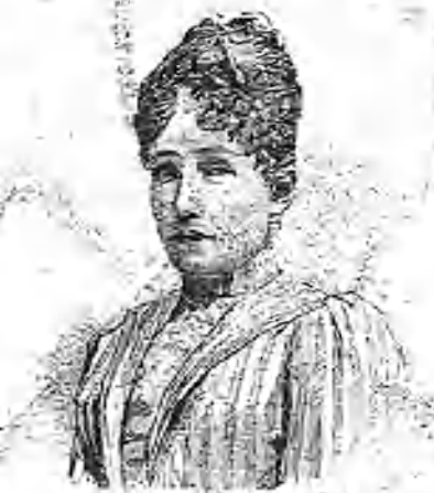
La princesa Estefanía, Viuda del príncipe Rodolfo.

No diré el nombre del autor de la comedia Volver á la razón estrenada en el Español, para no contribuir, por mi parte, á una propaganda que debe evitarse antes de que el puff la extienda;