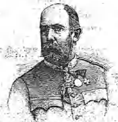
El archiduque Carlos Luis, Actual heredero de la corona de Austria-Hungría.