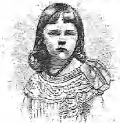
La princesa Isabel, Esposa del príncipe Rodolfo.