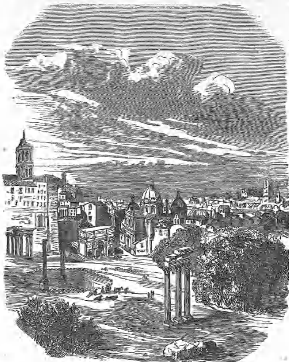
VISTA DE ROMA.