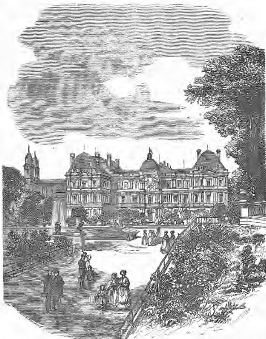
PALACIO DE LUXEMBURGO.

El palacio que representa este grabado ha tenido diversos nombres. Primero se le llamó palacio de Orleans, después de Luxemburgo, luego palacio del Directorio, en 1793; en 1800 palacio del Consulado; palacio del Senso conservador de 1804 á 1814, y después de esta época fué conocido con el nombre de palacio de la Cámara de los Pares, aunque generalmente se le llama palacio de Luxemburgo. Fué construido en 1615 por María de Médicis, regenta de Francia, después del asesinato de Enrique IV. Para su construcción sirvió de modelo el palacio Pitti de Florencia, residencia ordinaria del gran duque de Toscana, y es notable por su elegante arquitectura, su perfecta simetría y su solidez.