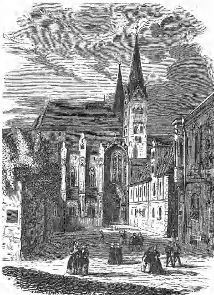
CATEDRAL DE AUGSBURGO.

Uno de los monumentos más notables y antiguos de Augsburgo es la iglesia catedral, que cuenta mas de 1500 años de antigüedad, debiendo por lo tanto existir ya en tiempo de Constantino el Grande; pero las noticias mas exactas que tenemos respecto á esto la hacen datar desde la fundación de una silla episcopal en el año 382.