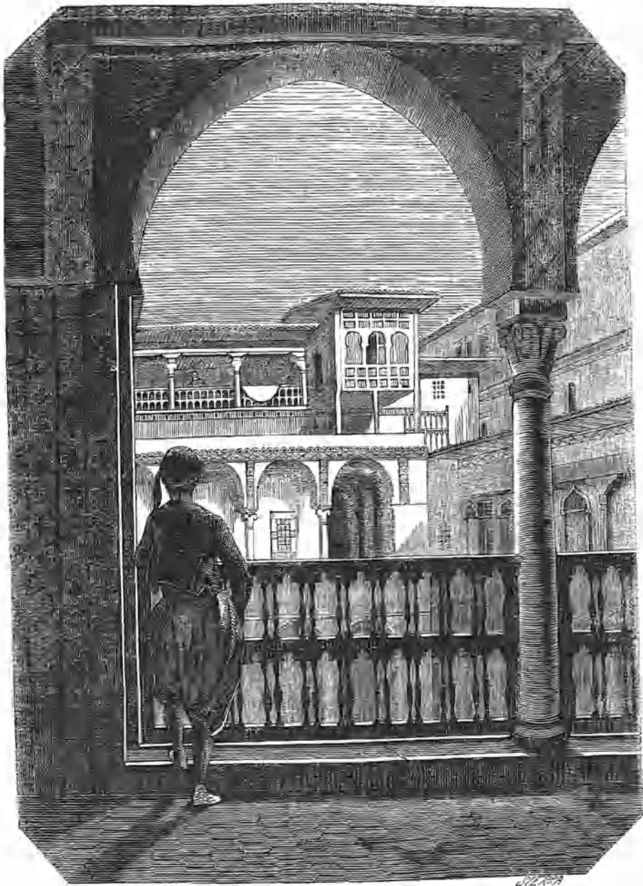
PALACIO DEL BEY EN ARGEL.

Una grande y pesada puerta, bastante semejante á la de una antigua entrada de ciudad, es el ingreso de la Kasbah ó palacio del bey de Argel. Una callejuela conduce al patio del divan que es espacioso; su pavimento es de mármol blanco y está rodeado de una galería cubierta, formada por arcos moriscos sostenidos por columnas también de mármol blanco. La fuente, de cuyo centro se eleva un débil surtidor, es el único adorno de este sitio, si se exceptua un enorme plátano de gran belleza, colocado en el ángulo opuesto al de la fuente y que la tradición supone contemporáneo de Barbaroja.