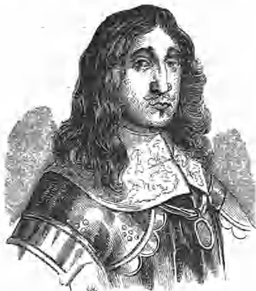
Don Juan de Austria.