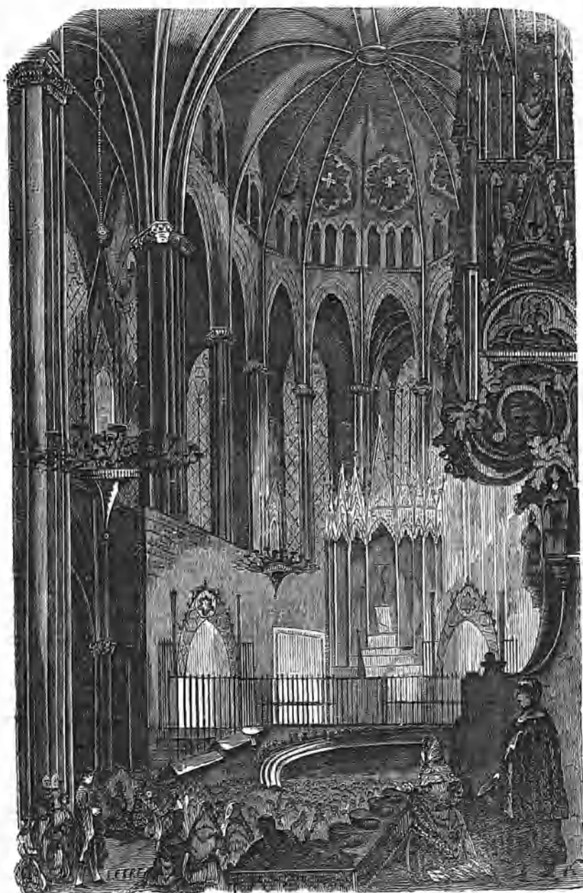
LA CATEDRAL DE BARCELONA.

La iglesia mayor de Sta. Cruz y Sta. Eulalia de Barcelona, pertenece á la arquitectura vulgarmente llamada gótica, y como su construcción duró tanto como el arte que la edificaba, al lado de la majestad, sencillez y elegancia de su primera época, ostenta los primores y costosas labores de fines del siglo XIV y principios del XV.