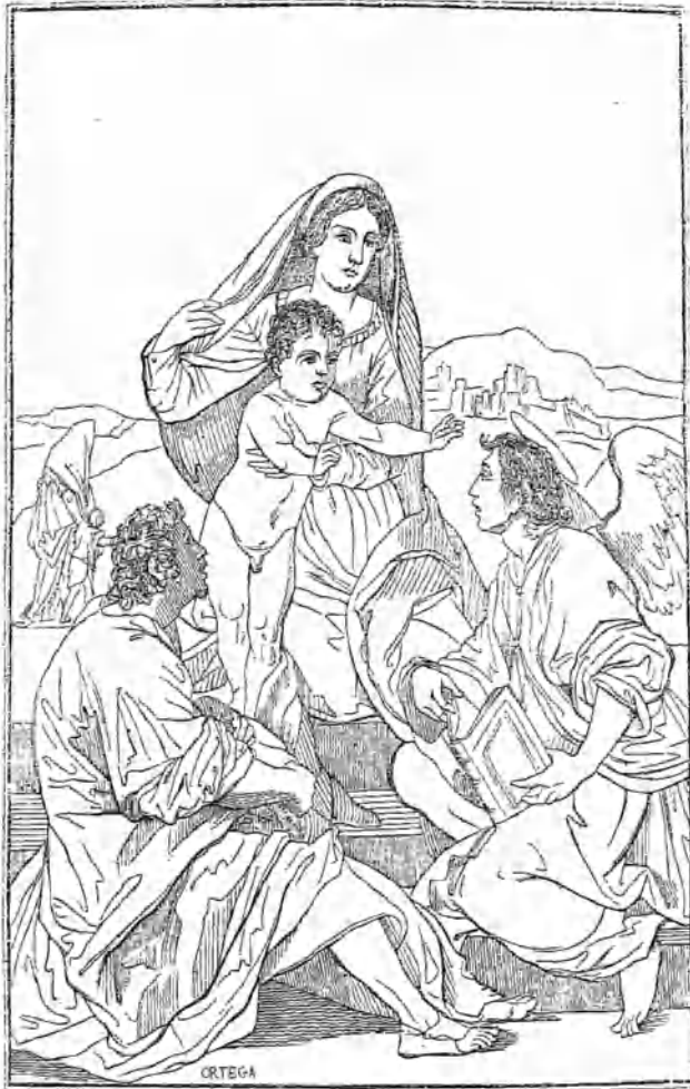
(La Virgen, el Niño Dios, S. José y un Angel.—Cuadro de Andres del Sarto)

Tabla de gran mérito, colocada en el Real Museo de Madrid. Tiene de alto 6 pies y 5 pulgadas, y de ancho 4 pies y 10 pulgadas. La escena es en campo abierto con cinco espaciosas gradas, y en ellas están colocadas seis figuras. La primera es la Virgen Santísima, que se presenta arrodillada, vista de frente en la tercera grada, con túnica roja y manto azul an la cabeza, que sostiene con la mano izquierda, y con la derecha detiene á su precioso hijo, que es la segunda figura, el cual desnudo y en pie se abalauza con los brazos á hablar á un angel mancebo, tercera figura, arrodillado en el lado izquierdo, sobre la primera y segunda gradas, vestido con túnica verde, forrada con color amarillo, y leyendo en un libro abierto, que