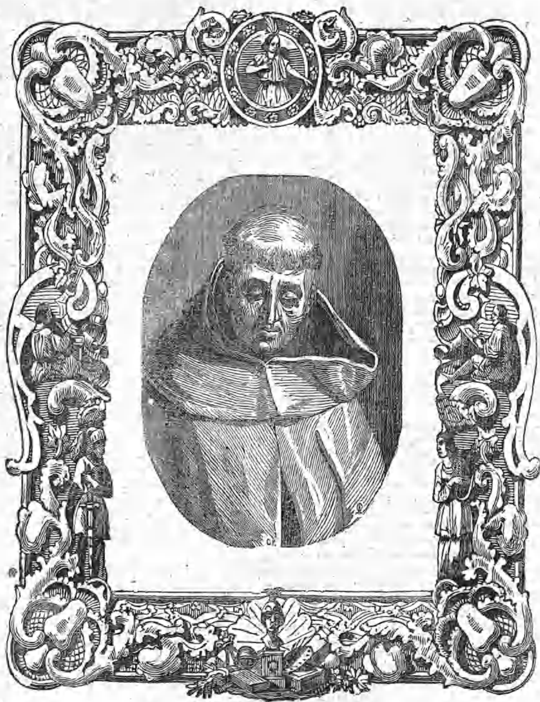
SAN JUAN DE LA CRUZ.

Entre aquellos admirables seres que, cual fragantes puras azucenas, brotaron en el verdadero siglo de las letras, décimo sexto de la era cristiana, y que renunciando á los fascinadores atractivos que les ofrecía en el mundo la opulencia de su