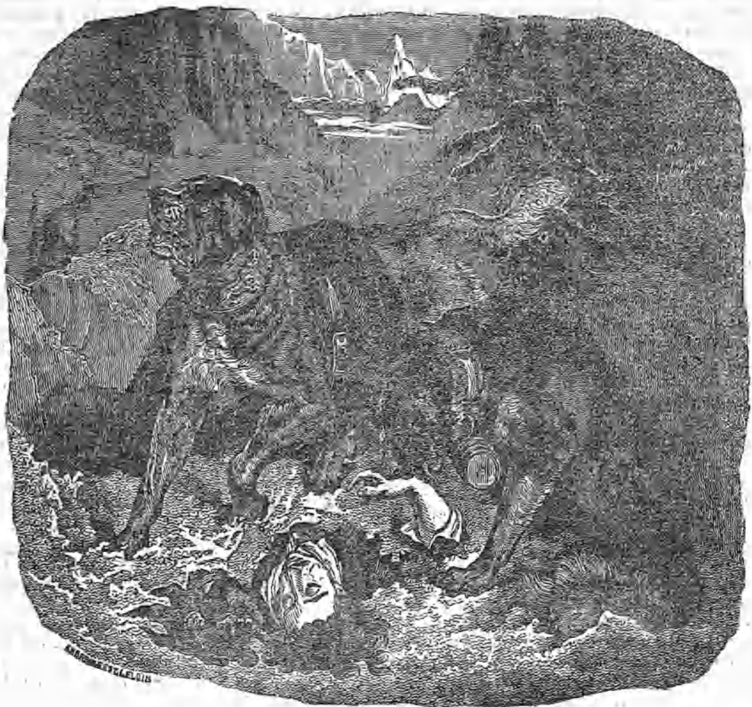
LOS PERROS DEL MONTE DE S. BERNARDO.

Una comunidad hay entre las órdenes monásticas de hombres que puede, en competencia con las de mujeres, ponerse en parangón con las hermanas hospitalarias de Santa Camila cuyo nombre heilla y resplandece en los anales de la caridad, que es la de los religiosos del monte de San Bernardo, de que fué fundador San Bernardo de Menthon.