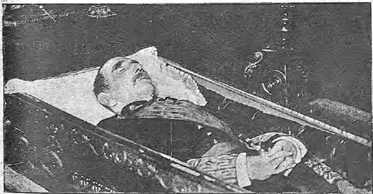
DE INSTANTANEA EN EL FÉRETRO