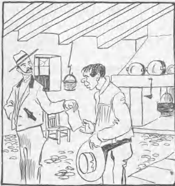
Escenas del cortijo.

— ¿Sabes quién creo que es esa istira que acaba de pasar por nuestro lado? — No adivino. — Pues D. Jaime de Borbón con refajo y picaporte.