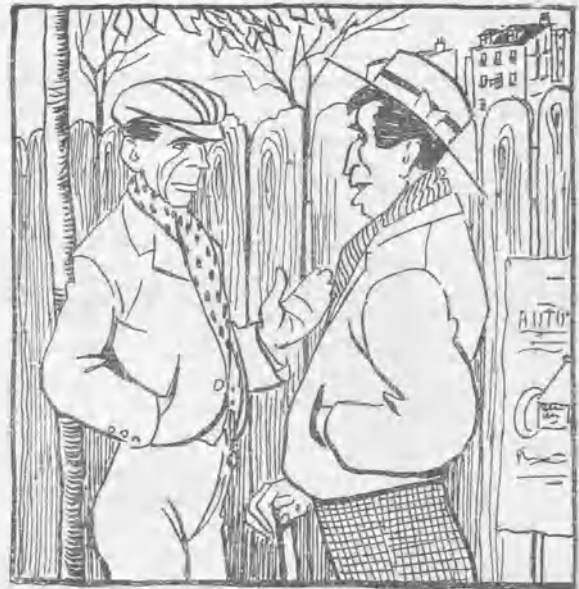
Los premios del natalicio.