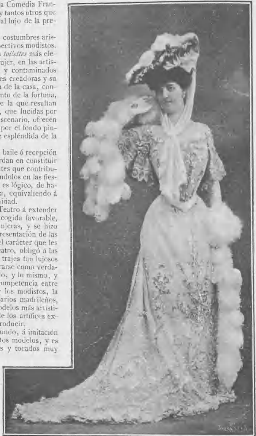
Traje de recepción y Teatro. Modelo de París.

Este traje es de tul blanco bordado en lentejuelas de plata, que forman artístico dibujo en la falda y en la chaqueta, bordeando el escote. La manga está adornada con finos encajes, y completan la toilette un boa de pluma rizada y sombrero adornado con flores y tul, que forma caprichosas lazadas y descende en larga caída.