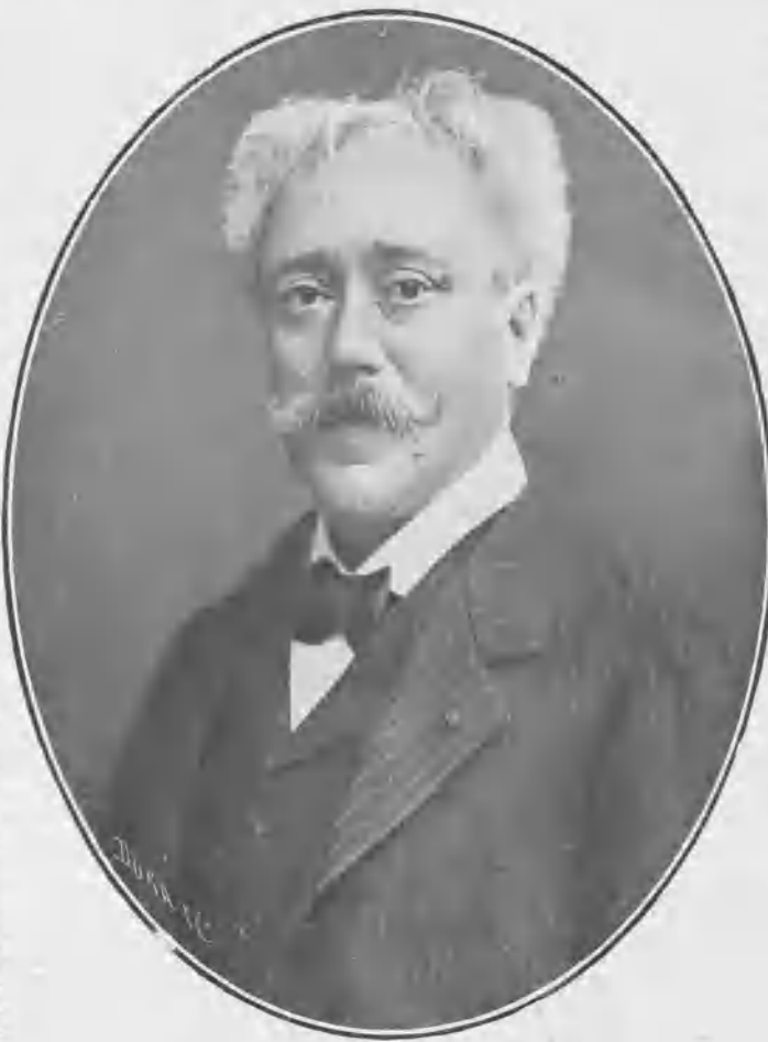
El eminente violinista Pablo Sarasate.