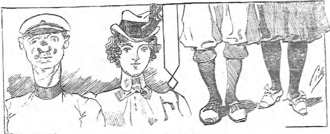
El traje de trabajo.