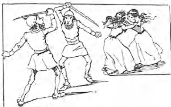
Llegó la noche del beneficio de la tiple.

El cuarto de la simpática Elvira se llenó de «cojertos» de valor y de capricho, «regalos de sus infinitos apasionados».