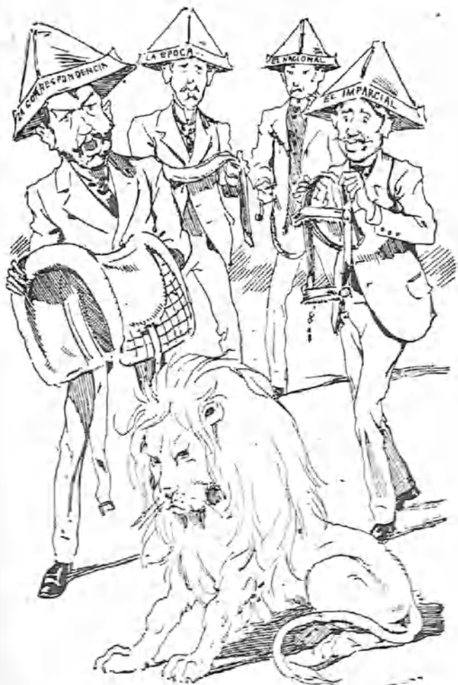
Los ministeriales.—Mucha calma, mucha prudencia; la energía no debe desplegarse hasta el último extremo...