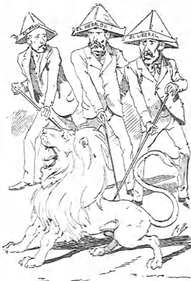
—¡Anda con ellos! ¡Sus! Que te injurien, que te escarnecen, que te solivianten... Si ahora no tienes energía estás perdido.