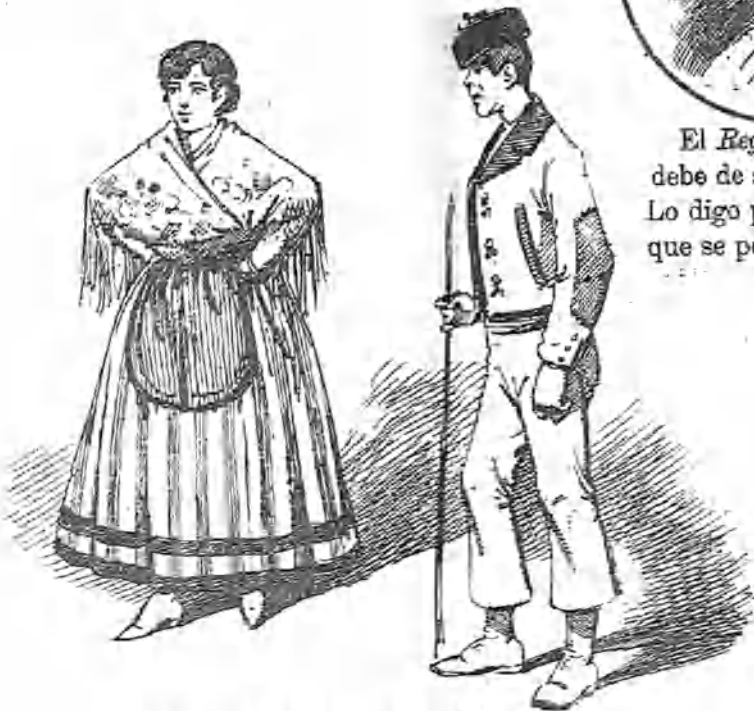
Indumentaris de los días de incienso.