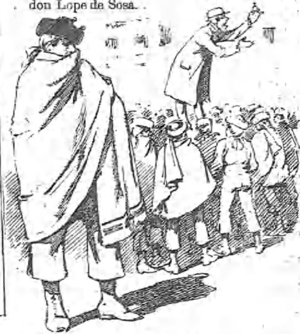
En la Plaza Mayor.