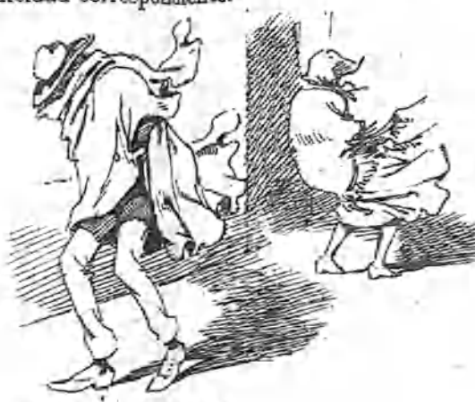
Este apunte copio ahí para hacer la observación de que siempre el viento aquí tiene honores de ciclón.