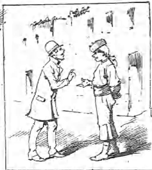
— De móo que ozté no sabe néa de esta tierra.