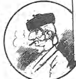
El Regatero también debe de ser de Jaén. Lo digo por el sombrero que se pone el Regatero.