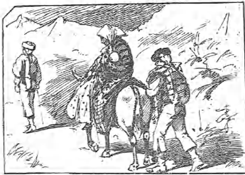
Una familia honrada que he visto en el camino de Granada.