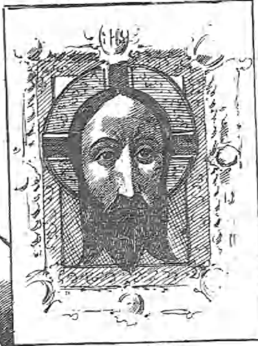
La cara de Dios.