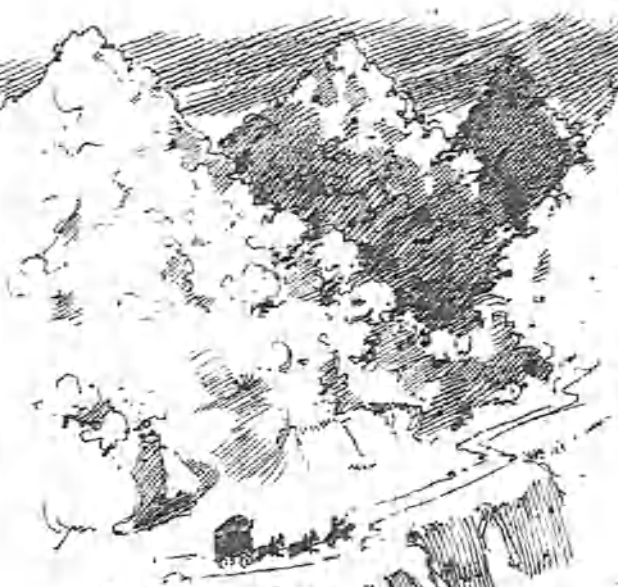
De Granada á Jaén.