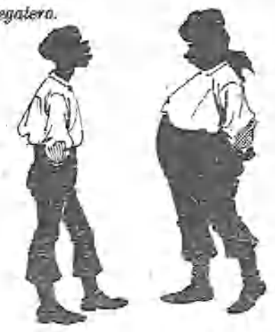
Los del ronquilo.