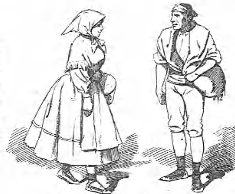
Los amantes de Teruel... modernos.