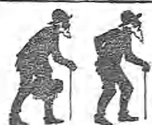
Al salir de la diligencia en Teruel.