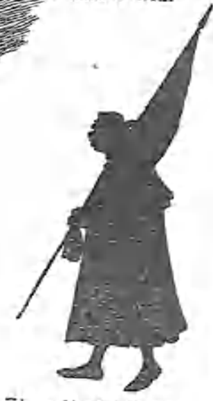
El pendón del Corpus.