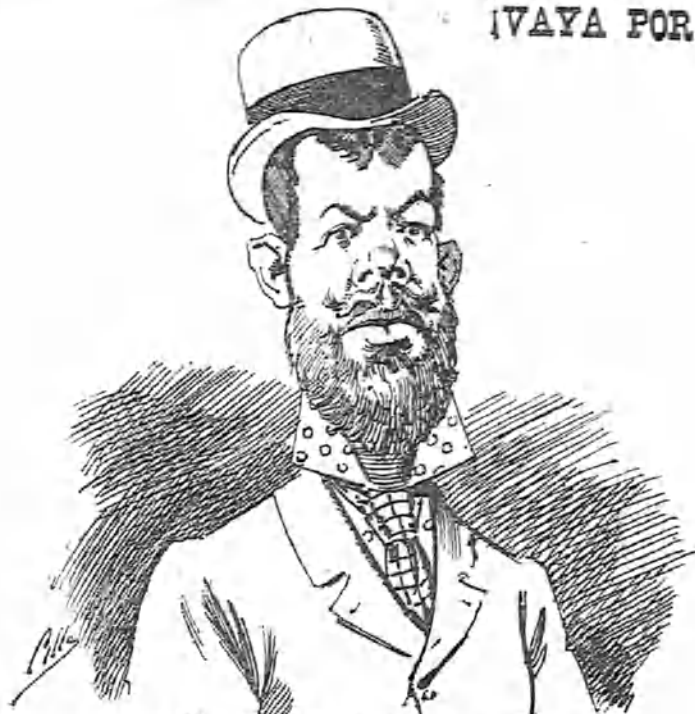
¡Hoy no me sale bien ninguna cosa; soy infeliz cual la que nace hermosa.