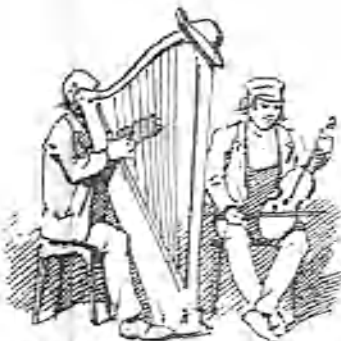
Música italiana en el café de la Concordia.