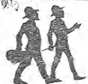
Al entrar en la diligencia en Calatayud.