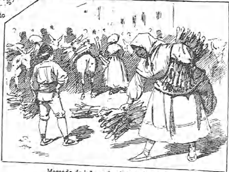
Mercado de leña en la plaza de Emilio Castelar.