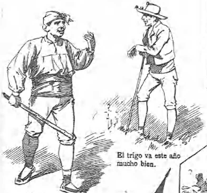
El trigo va este año mucho bien.

Si Marsilla é Isabel pueden ver su mala estrella, dirán de fijo ella y él: —¡Dios mío! ¡Y éste es aquél! —¡Santo Dios! ¡Y ésta es aquélla!