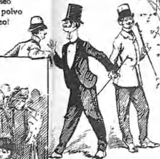
Del Fum-Club, sociedad de recreo, etcétera, etc.

Vete al Grao en tartana dando un paseo verás lo que es el polvo y el traqueteo!