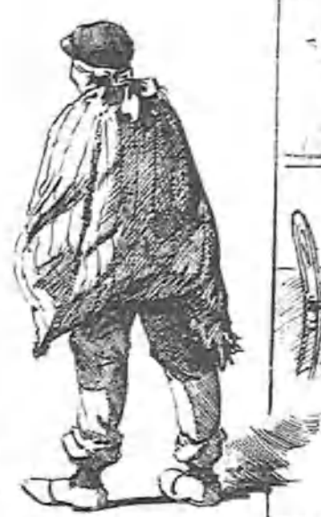
Vendedor de castañas.