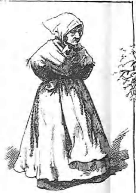
Algún maldiciente ocioso dirá que es un poco fea... ¡y es natural de Toboso, paisana de Dulcinea!