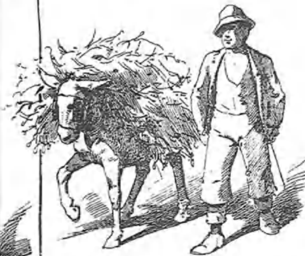
Industria y comercio.