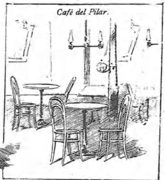
Café solo... completamente solo.