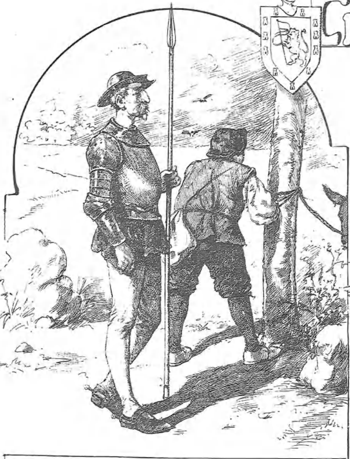
Los héroes del país.