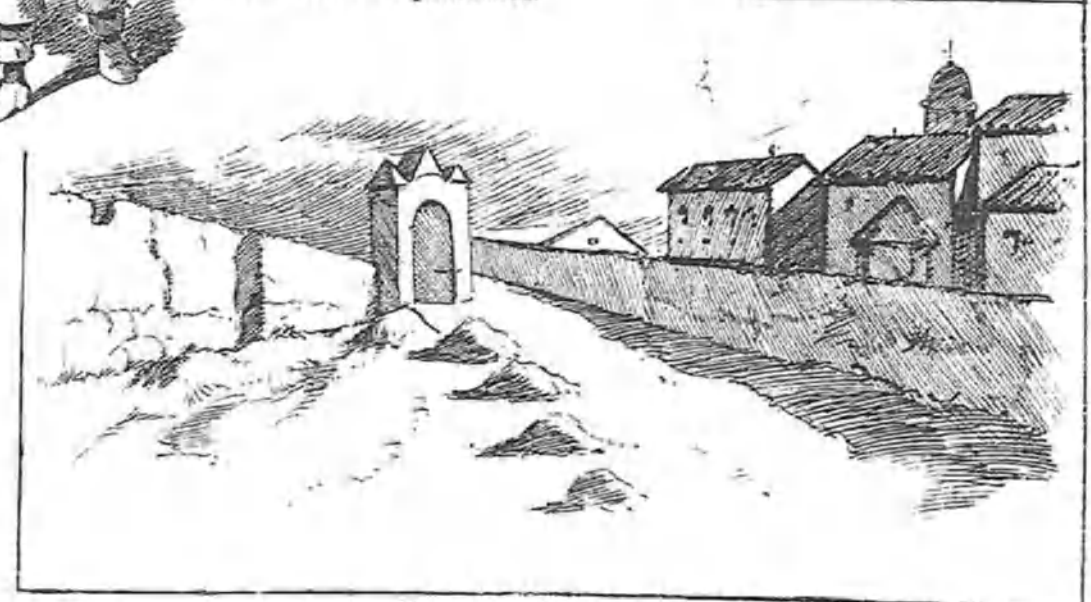
Un apunte de los alrededores.