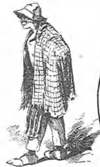
Un hombre de mala traza que toma el sol en la plaza.