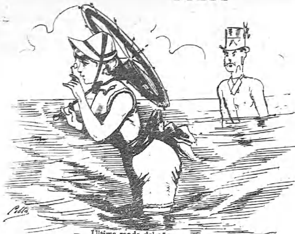
Ultima moda del año. Consiste, como verás, en entrar siempre en el baño con el lacayo detrás.