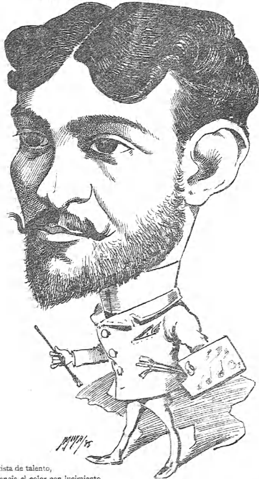
Artista de talento, que maneja el color con lucimiento, y prueba su valía