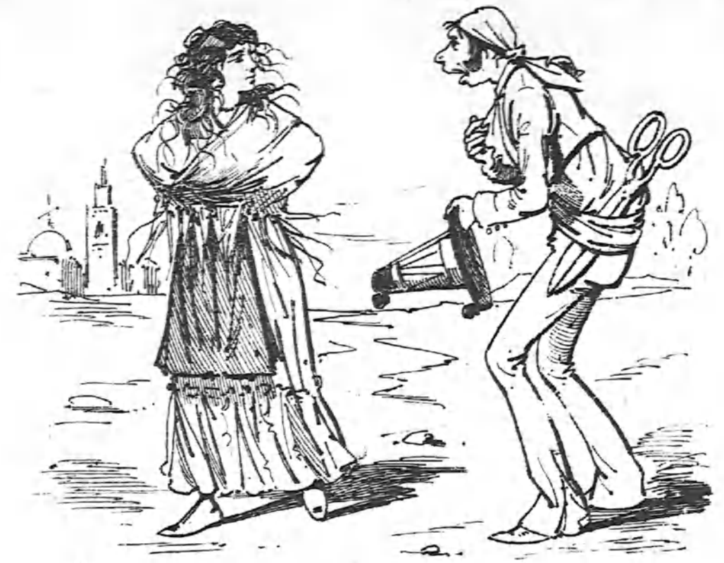
Y al momento le dije que no, que para gitanos no me pei no yo.