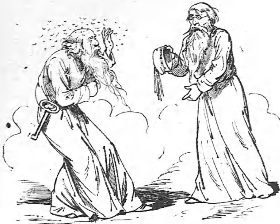
San Pedro, como era calvo, le picaban los mosquitos, y su padre le decía: —¡Ponte el gorro, Periquito!