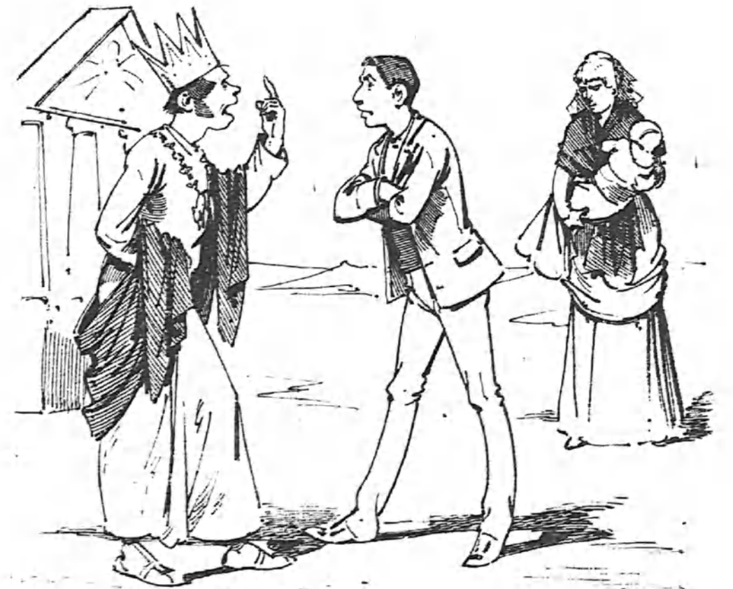
Dice el sabio Salomón que el que engaña á una mujer no tiene perdón de Dios... si no la engaña otra vez.