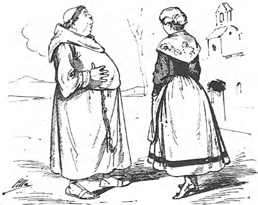
Un fraile me requirió un lunes por la mañana; yo le dije:—Padre mío, ¡miércoles de semana!