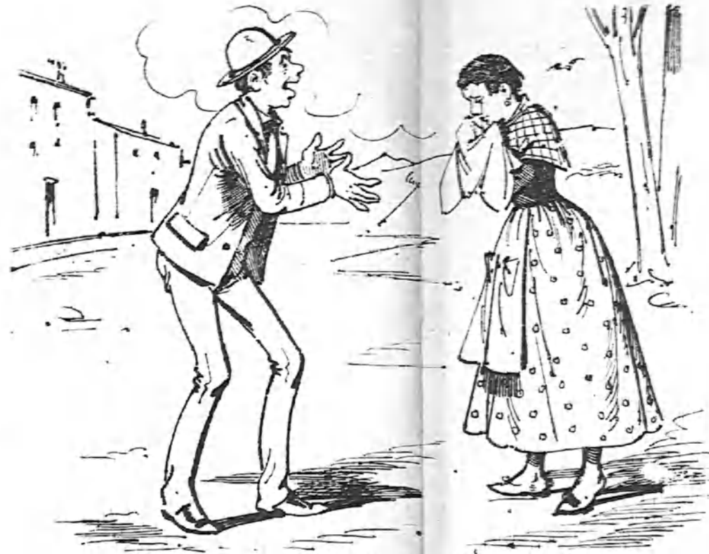
Una vez que quisiera fué por el pelo; ahora que estás pelona ya no te quiero.