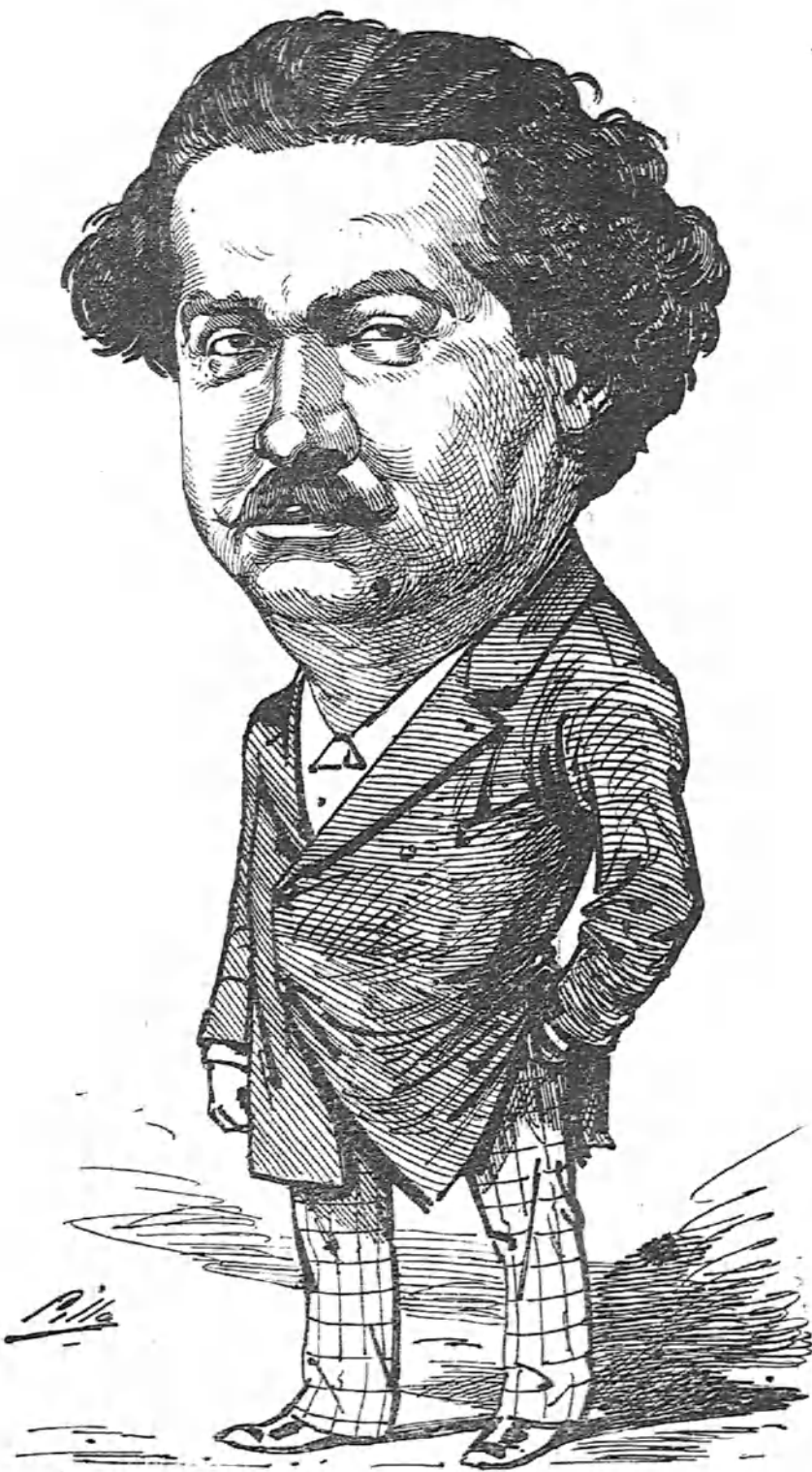
El de Brabo, Desengano. 14 y Carbon. 7 Madrid.

Al gran actor italiano, portento de inspiración, se le aplaude en castellano con muchísima razón