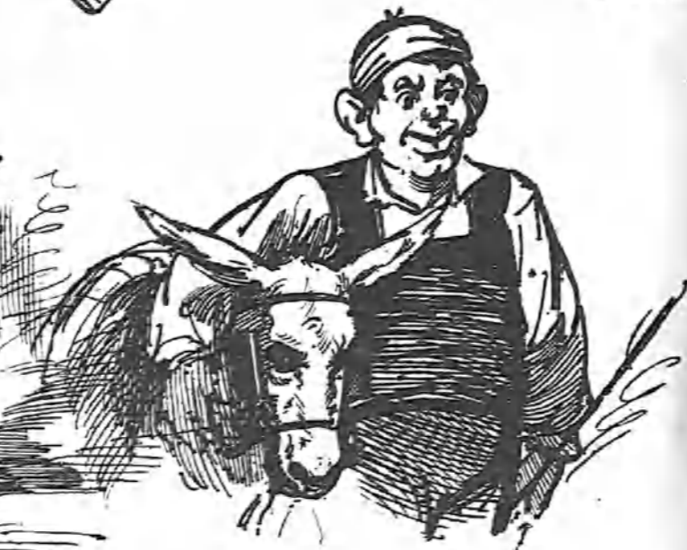
—Yo soy de ahí, de un pueblo á media hora de Torrelodones. Éste no había venido nunca á Madrid, y dije, digo: —¡Pus aprovecharemos las fiestas!