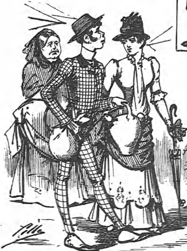
—Voy á comprar una torta. —No seas así, mamá, ¡que es mucha carga! —No importa, Pepito la llevará.