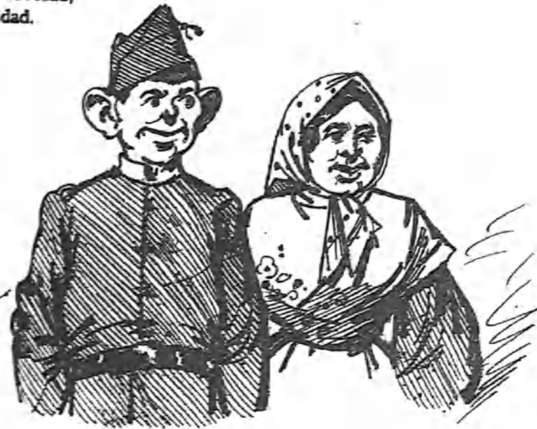
—Esta se empeñaba en que la convidara á to- rraos... ¡pa reirse luego en el pueblo! ¡Pero bonitos semos los militares pa que nos tomen de primos.