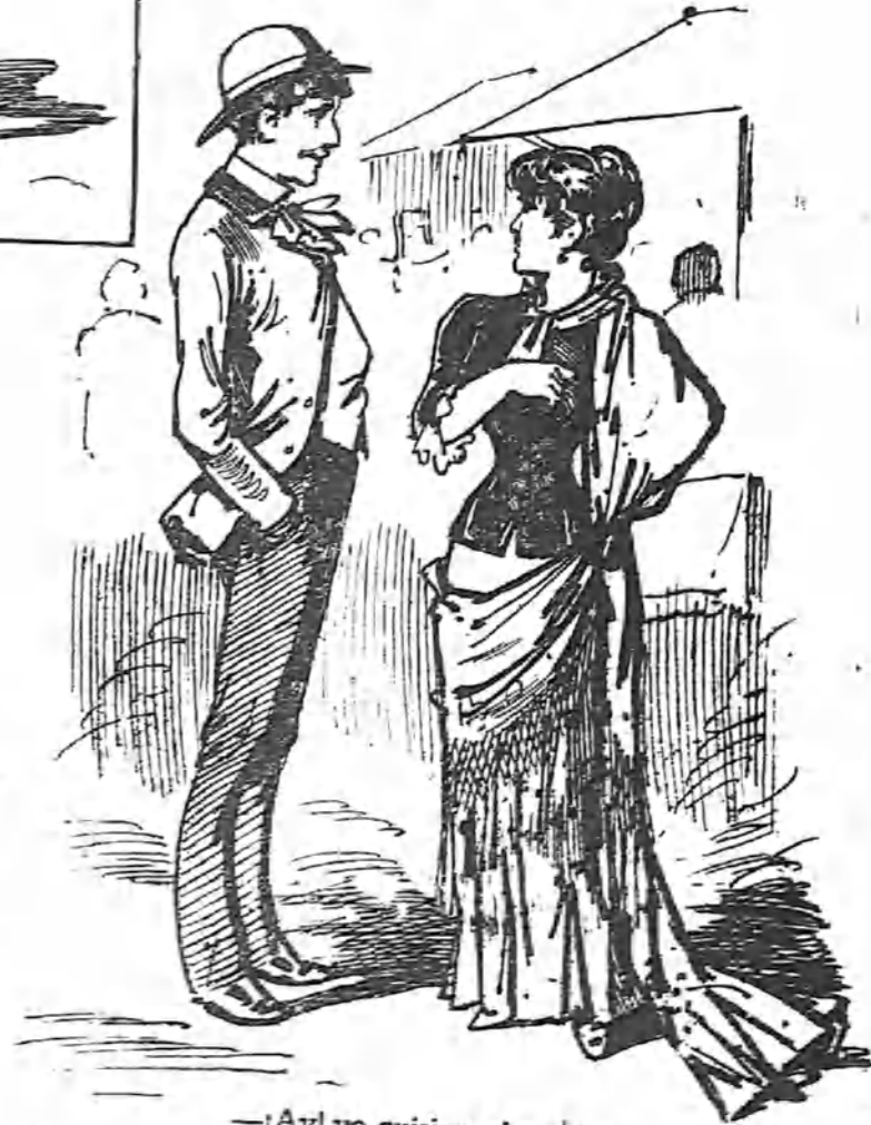
—¡Ay! yo quisiera obsequiar á ese salero bonito. —¡Hombre! y ¿qué me va usted á dar? —Pues... ¡un pito!