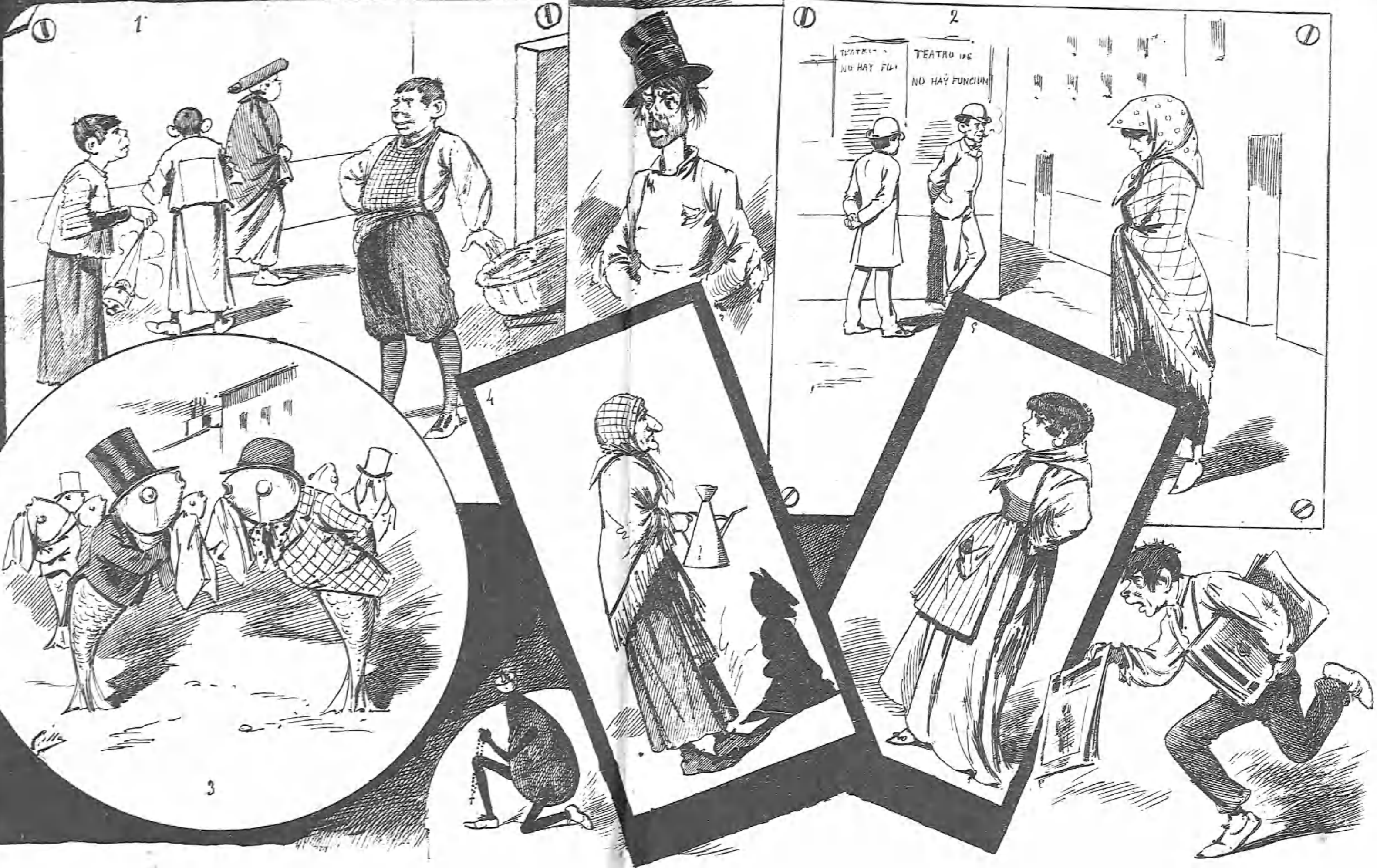
1.º—Los que trabajan.