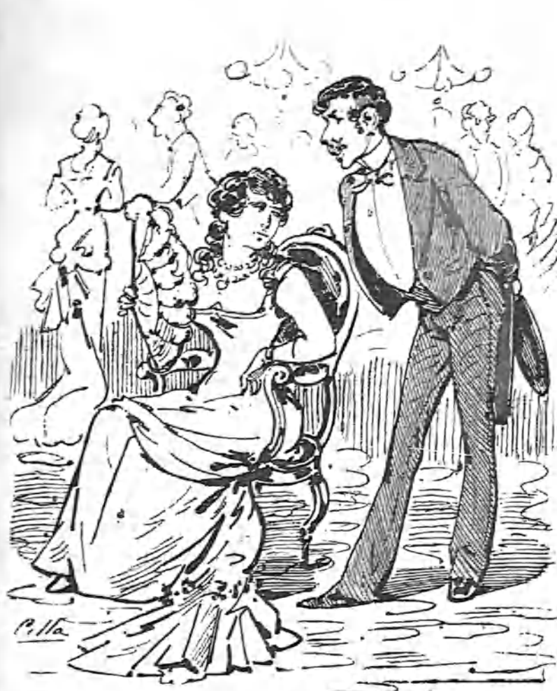
Por todo lo alto.

Yo que de franco me paso cuando hablo en serio, la desengañé por completo diciéndola: