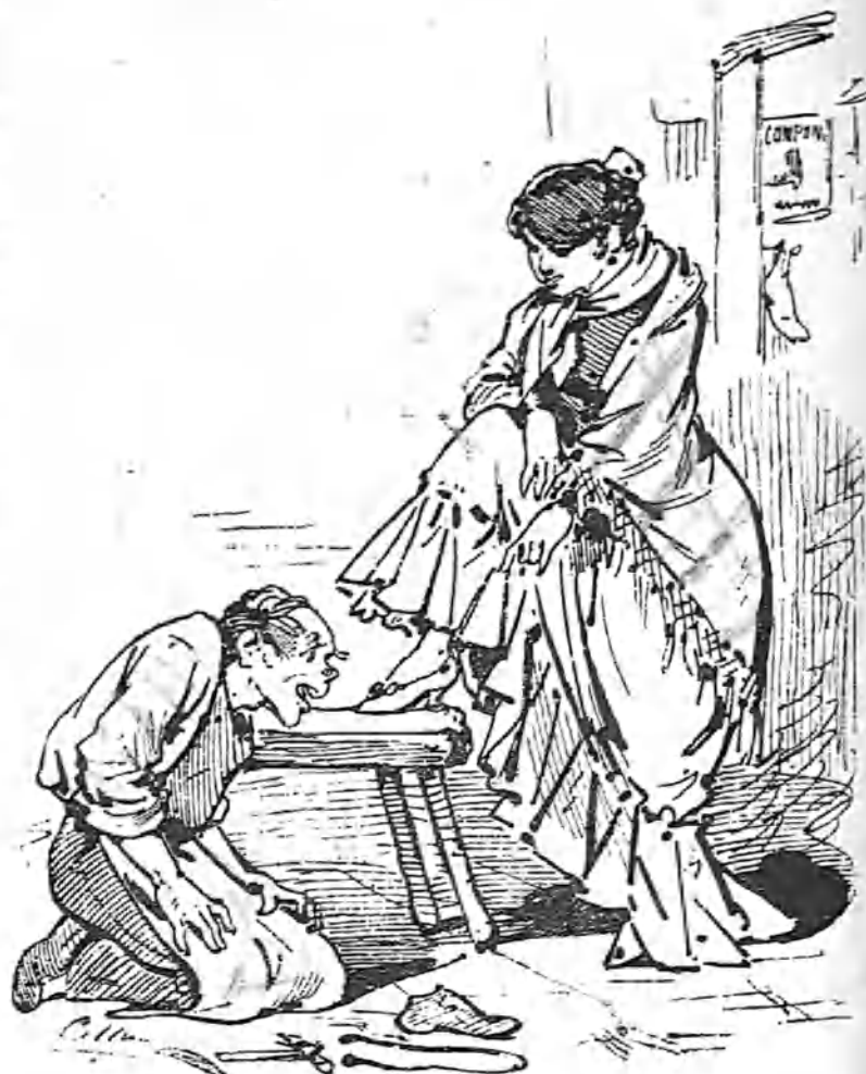
Por todo lo bajo.