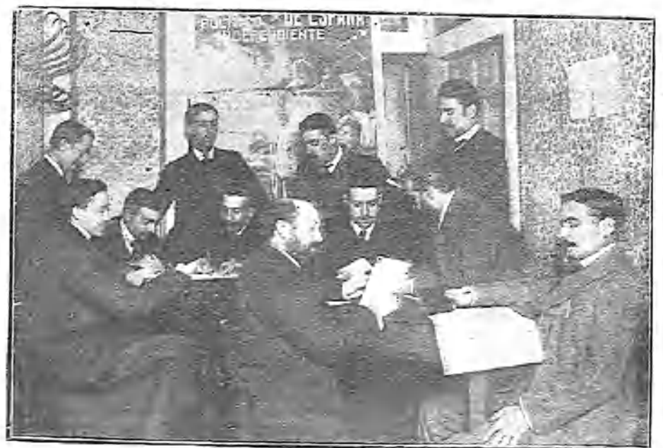
LOS «REPORTERS» JUDICIALES DE LOS PERIÓDICOS DE MADRID, REUNIDOS EN EL CENTRO RECIENTEMENTE INAUGURADO.