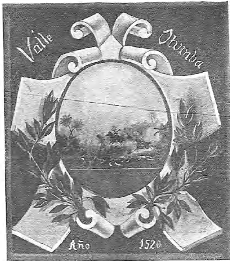
ESCUDO DEL REGIMIENTO DE INFANTERÍA DE OTUMBA, COLOCADO EN EL INGRESO AL CUARTO DE BANDERAS DEL CUARTEL DE SAN FRANCISCO