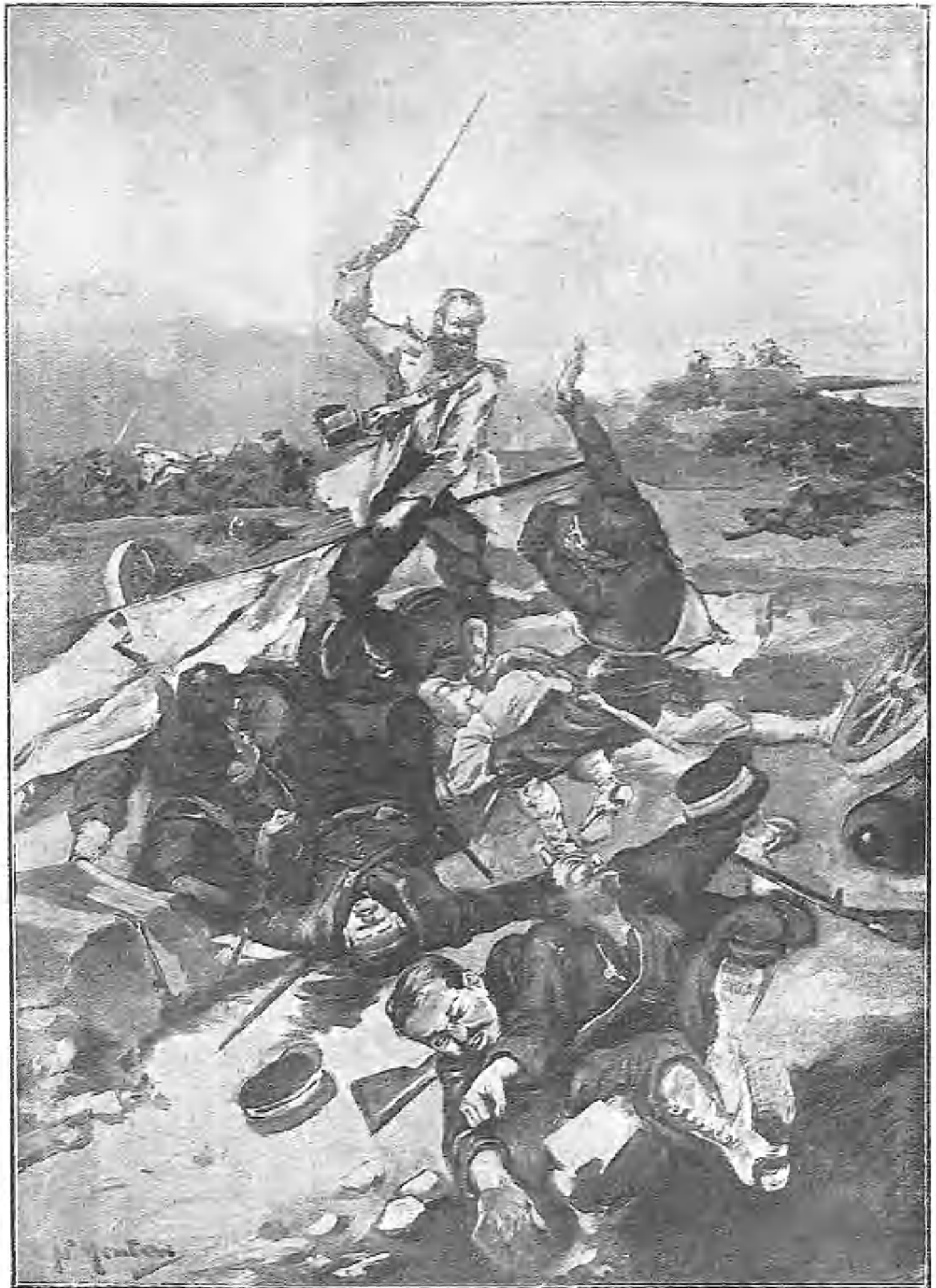
EL ÚLTIMO SUPERVIVIENTE DE LOS SERVIDORES DE UNA BATERÍA RUSA DEFENDIENDO SU BANDERA EN ÉPICA LUCHA CUERPO Á CUERPO

tos en preparativos, pago de vapores que acompañan al nadador, etc., etc., éste tiene una porción de ingresos, porque, por ejemplo, si se alimenta durante el ejercicio con carne condensada de tal ó cual fábrica, esta fábrica le paga un tanto por la propaganda que hace de sus productos; el hotel donde se hospeda, no sólo le aloja gratis, sino que además le da dinero, por la misma razón; puede también alquilar asientos en los barcos que le acompañan, y así, no sólo se resarce de los gastos que ha tenido que hacer, sino que además gana dinero.