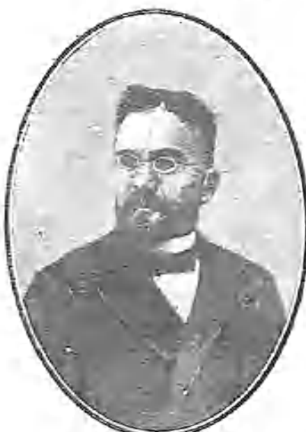
EL ALCALDE DE VALLADOLID, D. PEDRO VAQUERO CONCELLÓN, QUE HA DADO MOTIVO AL ESCÁNDALO MUNICIPAL