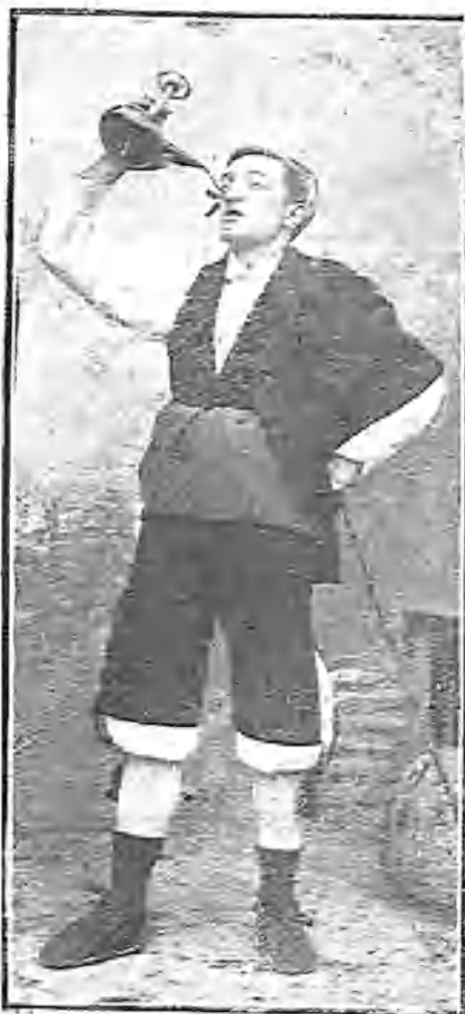
UN TIPO DEL PAÍS (Fols. E. Capella.)

«Por ejemplo, ya conocemos un suero que ataca al microbio del botulismo, el cual puede producir un trastorno de la mayor importancia en el aparato digestivo humano.»