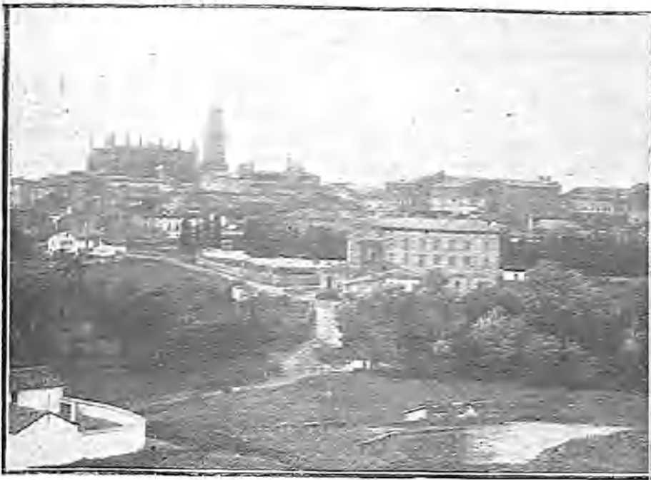
VISTA DE LA CIUDAD