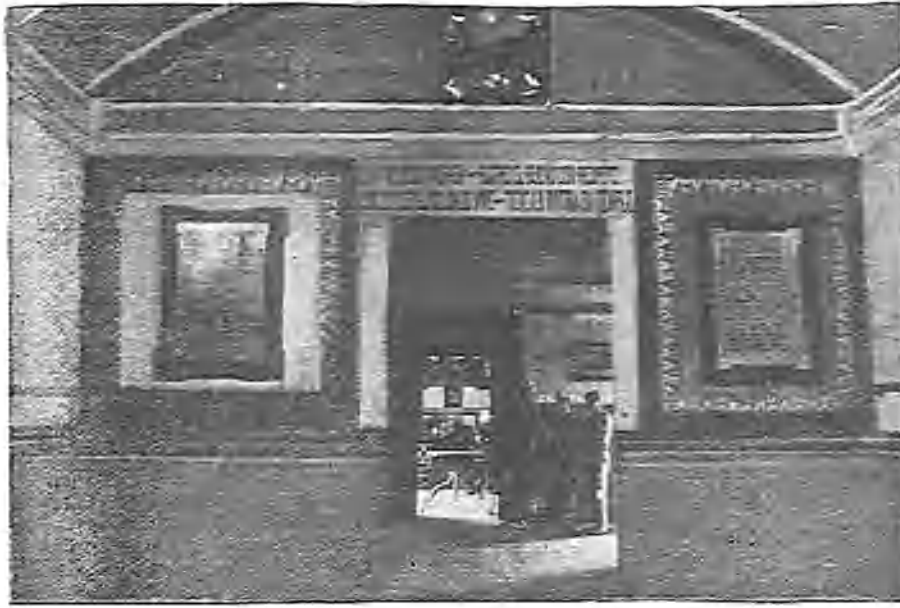
INGRESO AL CUARTO DE BANDERAS Y PATIO DEL CUARTEL DE SAN FRANCISCO, EN QUE SE ALOJA EL REGIMIENTO DE OTUMBA