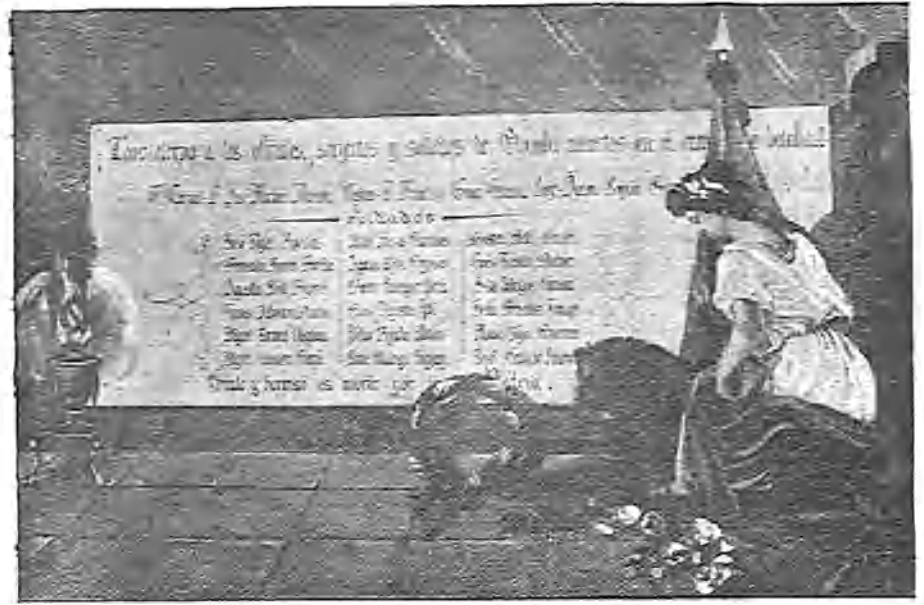
CUADRO DE HONOR EN QUE FIGURAN LOS NOMBRES DE LOS JEFES, OFICIALES Y SOLDADOS DE OTUMBA, MUERTOS EN EL CAMPO DE BATALLA