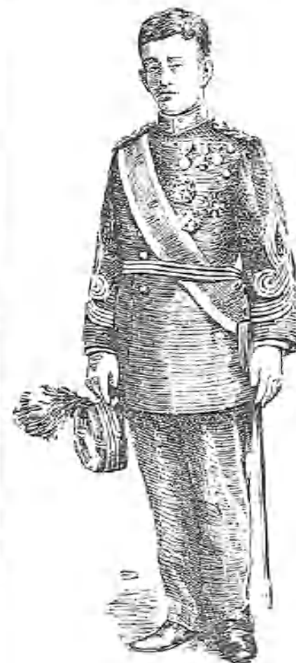
YOSHIOBU MARSHALL, Príncipe heredero del Japón

Se ignora quienes puedan ser los autores y el total de la cantidad robada.