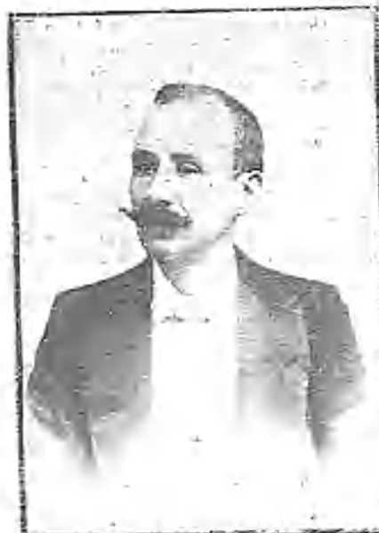
D. ALFREDO QUEIPO, EXALCALDE DE VALLADOLID, PRIMER FIRMANTE Y DEFENSOR DEL VOTO DE CENSURA