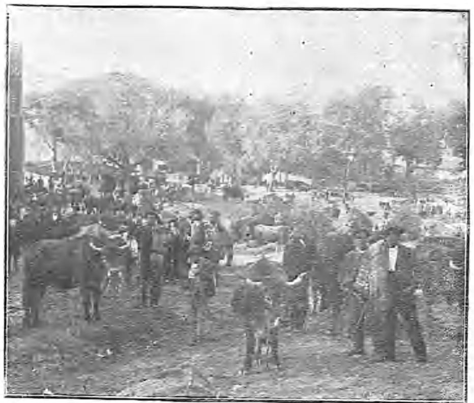
LA FERIA DE GANADOS