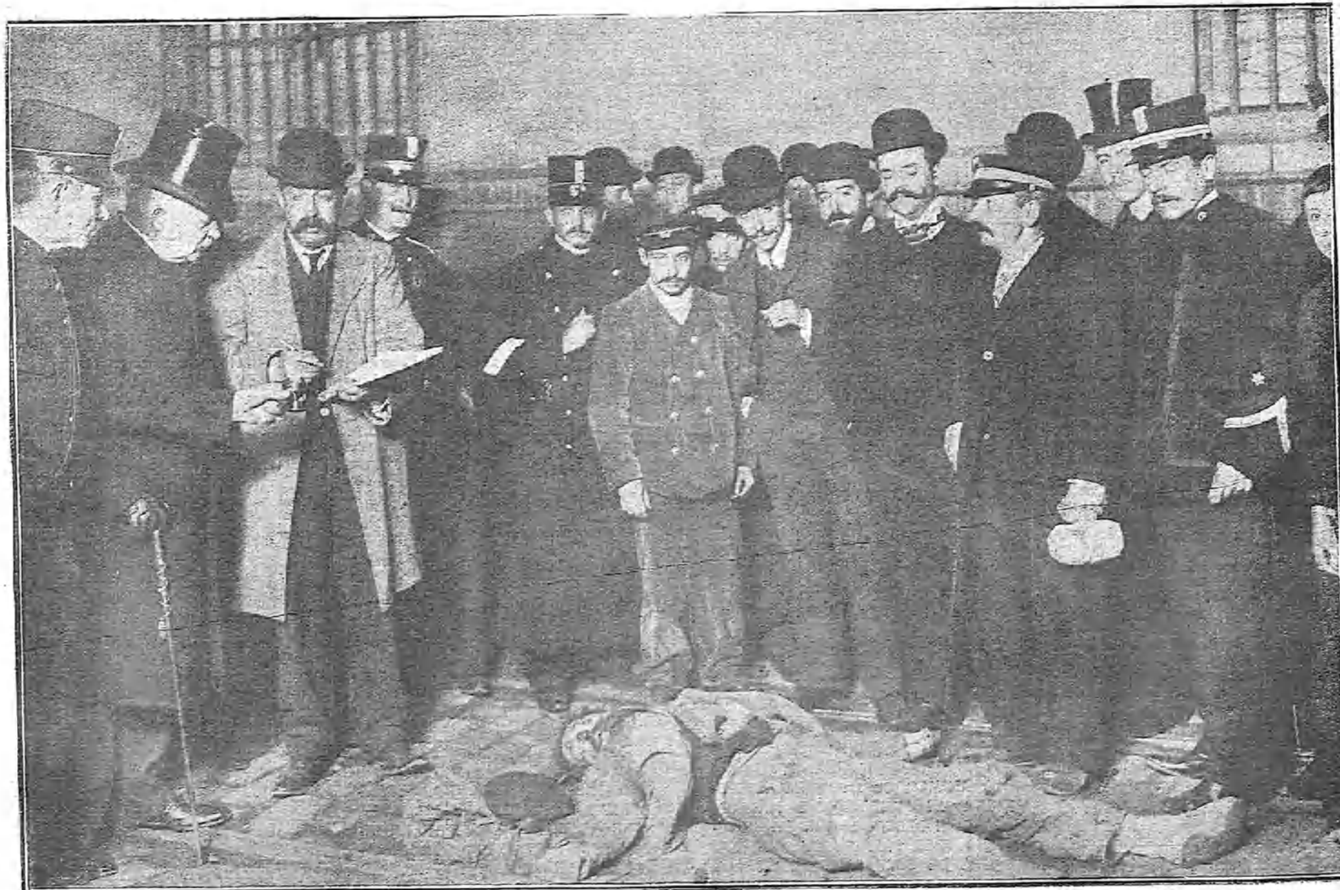
EL JUZGADO PROCEDIENDO AL LEVANTAMIENTO DEL CADAVER DEL HOMBRE ATROPELLADO ANOCHE POR EL TRANVIA NUM. 148 EN LA CALLE DE HORTALEZA