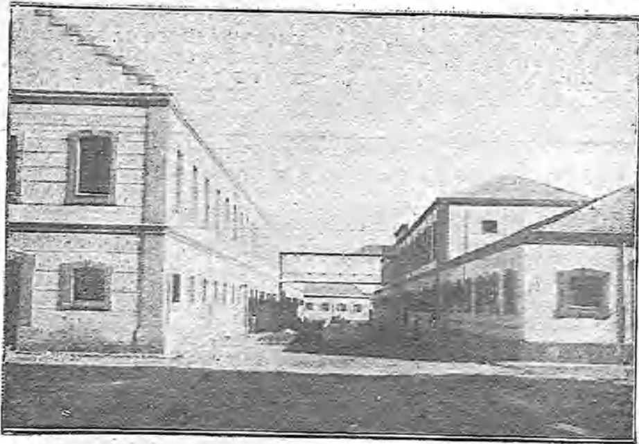
VISTA PARCIAL DE LOS PABELLONES DEL NUEVO CUARTEL

alojado tropas. Por otra parte, el pueblo de Jetafe, que ha contribuido entusiasmado á su instalación, recibió á las tropas con gran regocijo y festejándolas cariñosamente.