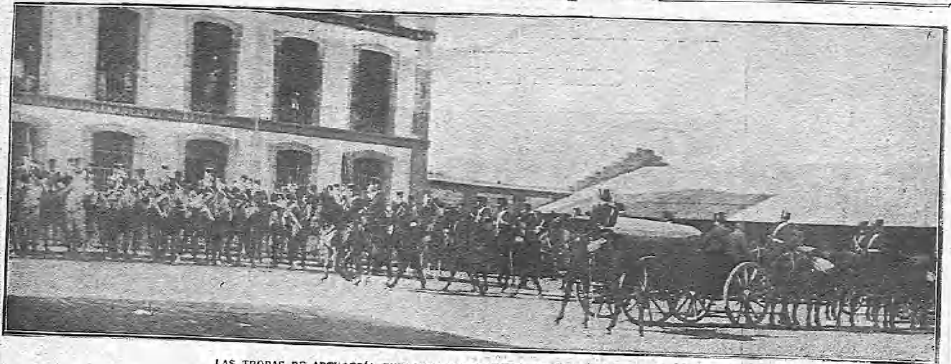
LAS TROPAS DE ARTILLERÍA ENTRANDO EN EL NUEVO CUARTEL CONSTRUÍDO EN JETAFE