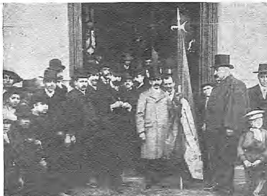
LA COMISIÓN DE LITERATURA Y BELLAS ARTES DEL LICEO ACCITANO, DE GUADIX, DIRIGIENDOSE Á LA CEREMONIA

Esta huelga ha hecho perder á los canteros indicados, según cálculos del Daily Chronicle , jornales por valor de un millón de libras esterlinas.