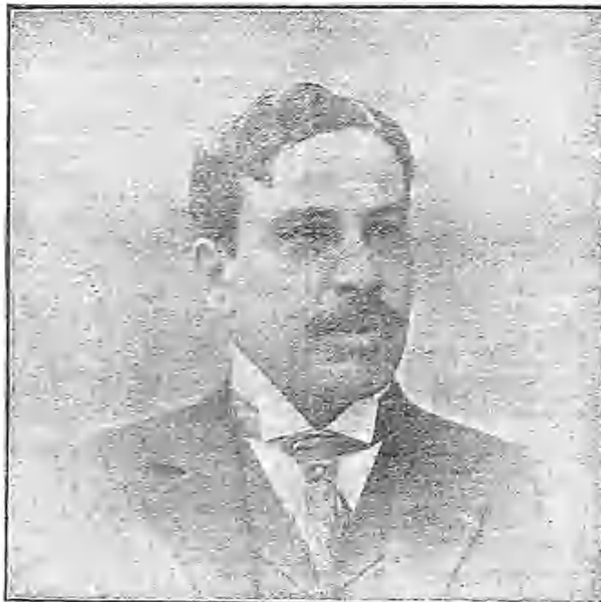
Autor de Le retour de Jerusalem , obra estrenada anoche en el teatro de la Princesa