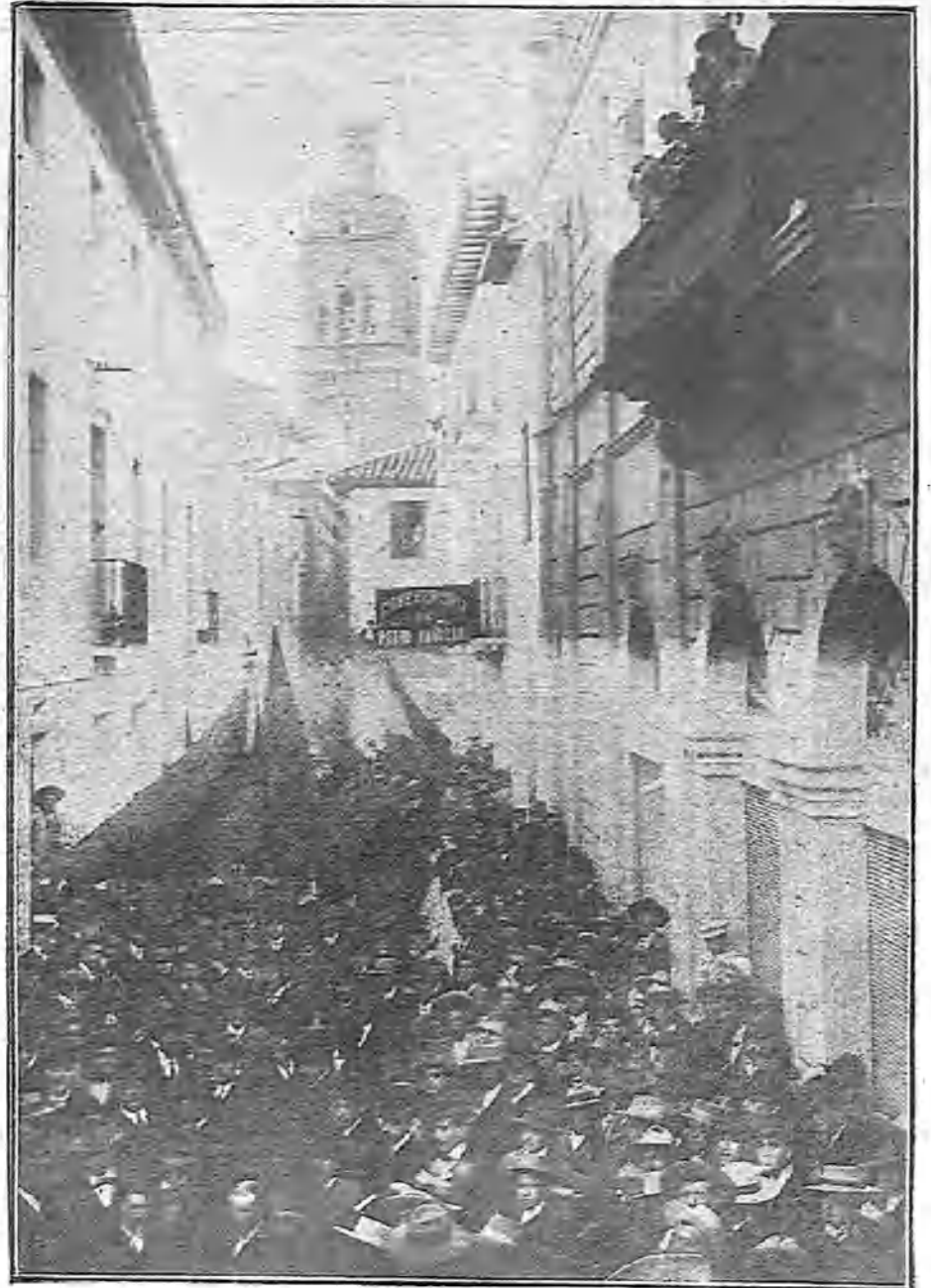
MOMENTO DE DESCUBRIR LA LÁPIDA EN MEMORIA DE PEDRO ANTONIO DE ALARCÓN, EN LA CALLE DE SU NOMBRE