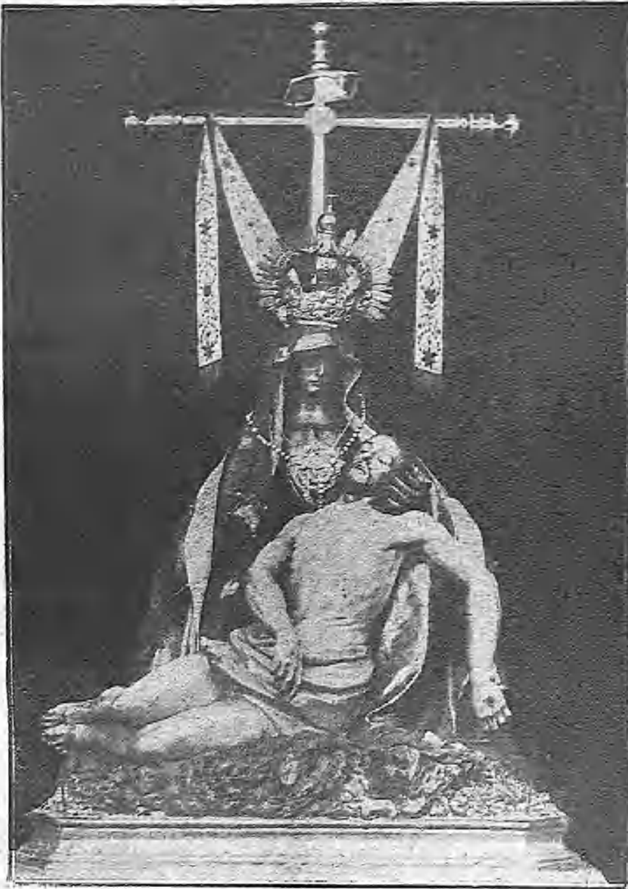
LA VIRGEN DE LAS ANGIUSTIAS, PATRONA DE GUADIX, OBRA DEL ESCULTOR SALSILLO