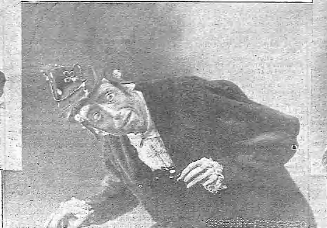
ALLEN-PERKINS EN «LUIS ONCENO»

Los actores que con él trabajan son modestos, pero jóvenes y con muchos alientos.