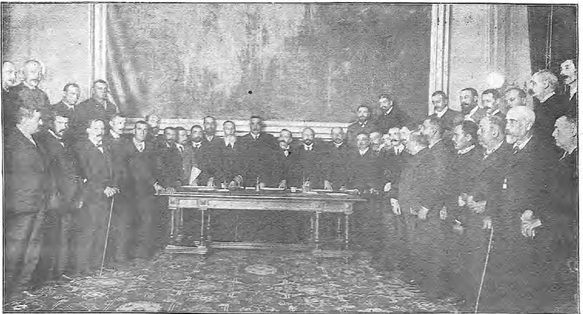
SENADORES, DIPUTADOS Y REPRESENTANTES DE LAS PROVINCIAS, CELEBRANDO UNA REUNIÓN EN EL CONGRESO