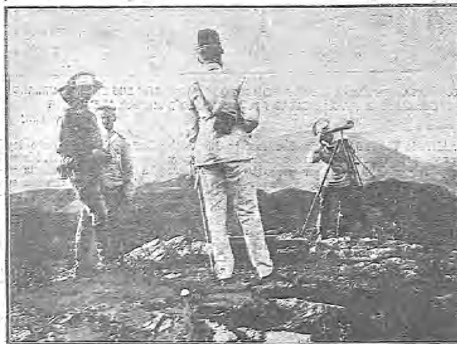
EL GENERAL KUROPATKIN OBSERVANDO AL ENEMIGO DESDE EL CAMPO DE OPERACIONES