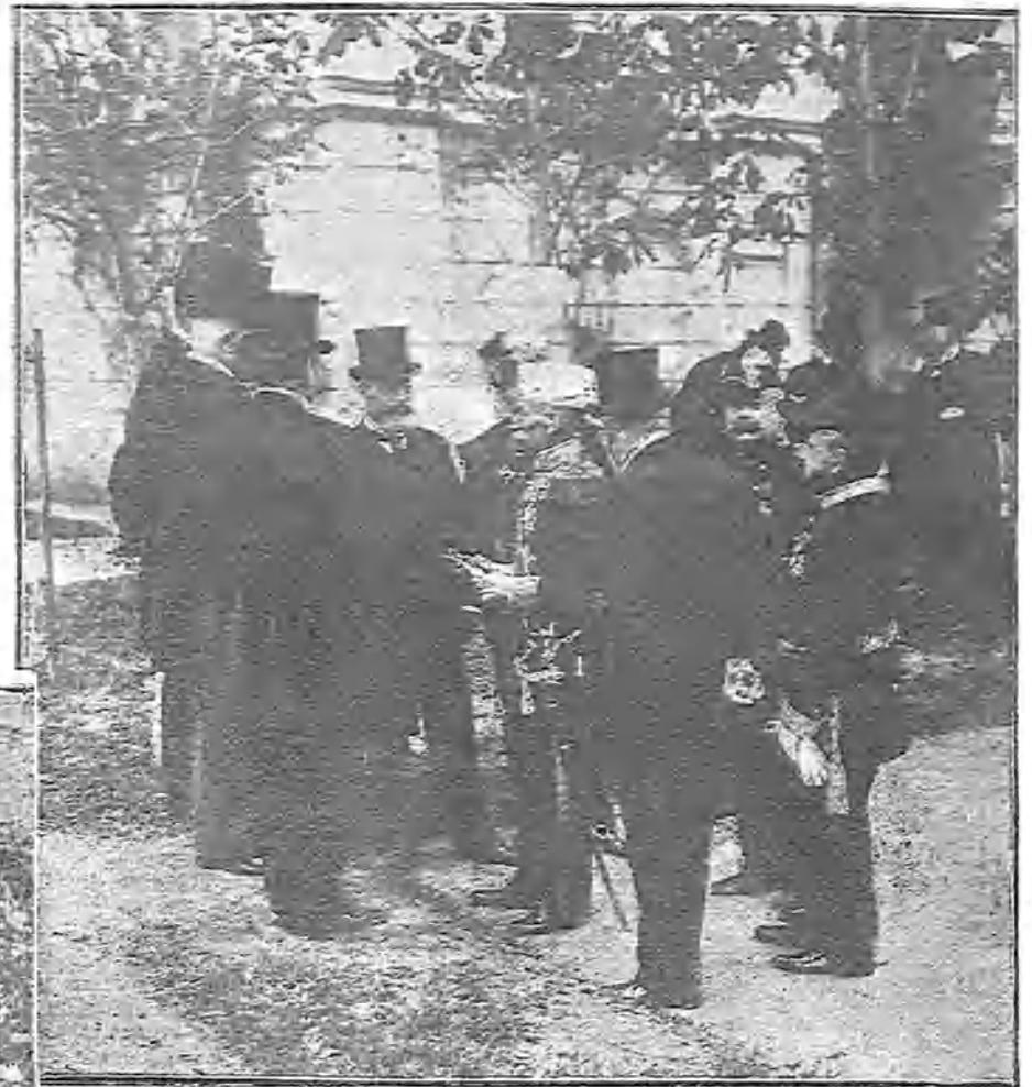
PEDRO I, RECIBIENDO A LOS OFICIALES FRANCESES EN BELGRADO

Fueron cariñosamente recibidos por el Rey, y al día siguiente, reunidos en íntimo banquete todos los de la promoción, brindaron juntos por su antigua Escuela, por sus antiguos regimientos y por el Ejército francés.