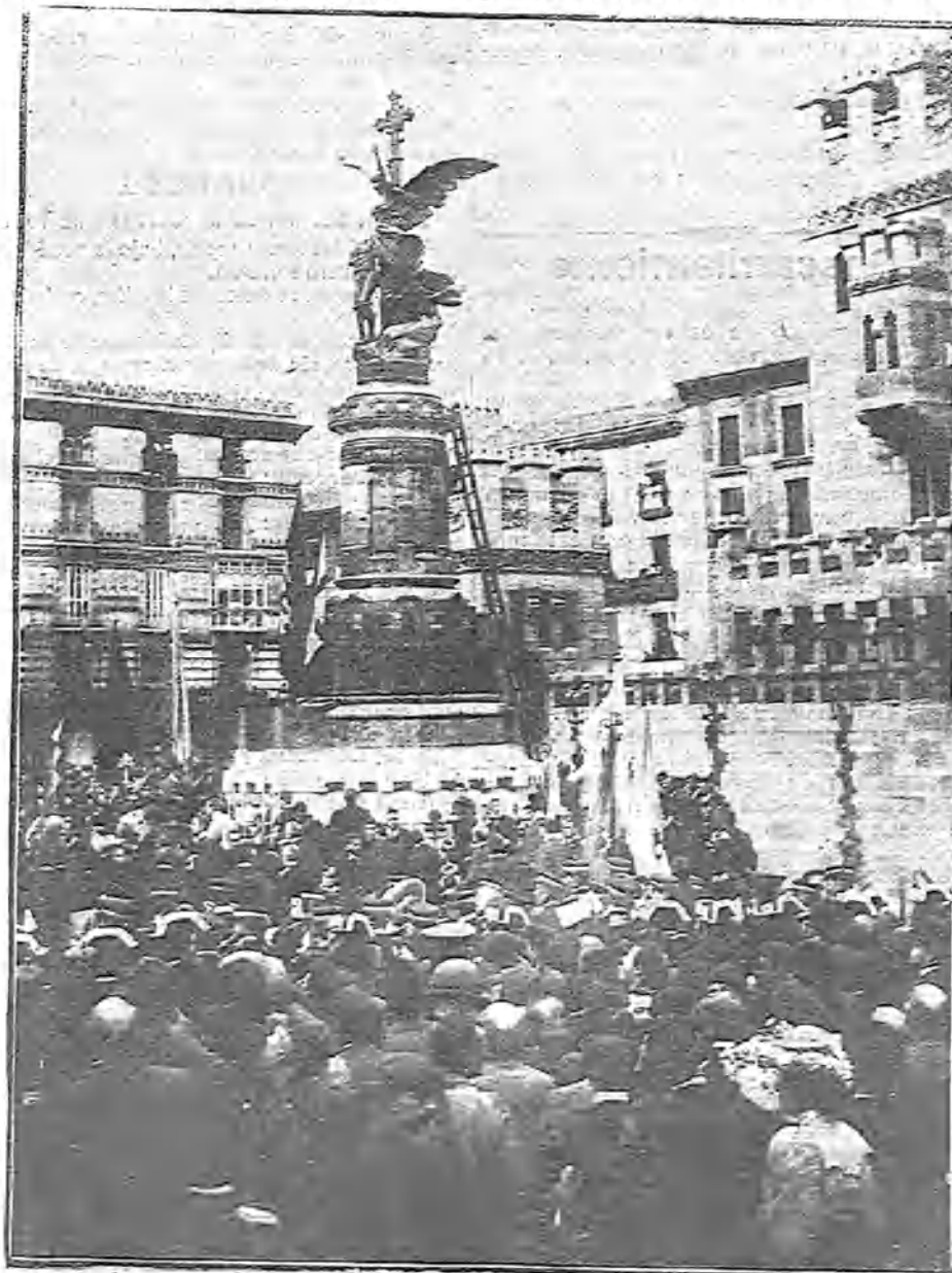
EL MONUMENTO A LOS MARTIRES EN EL MOMENTO DE SER DESCUBIERTO