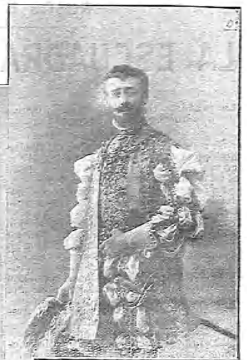
ALLEN-PERKINS EN EL «TENORIO»

La señorita Velázquez, discretísima actriz y encantadora mujer, tiene, indudablemente, grandes condiciones para la escena, en la que aún lleva muy poco tiempo, y bien pudo apreciarse la noche de su presentación.