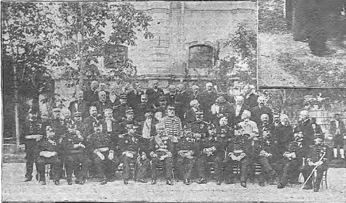
EL REY DE SERVIA, PEDRO I, CON LOS OFICIALES FRANCESES DE SU PROMOCIÓN, A QUIENES INVITO CON MOTIVO DE LAS FIESTAS DE LA CONSAGRACIÓN

Como dijimos en nuestro número de ayer, anteanoche se reunieron en la sección de Presupuestos del Congreso los representantes de Ayuz