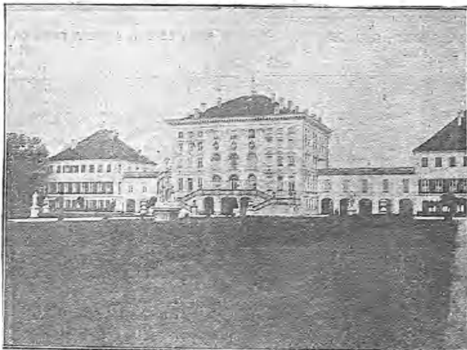
EL CASTILLO DE NYMPHENBURG, EN LAS CERCANÍAS DE MUNICH, RESIDENCIA DE LOS PRÍNCIPES DE BAVIERA, INFANTES DE ESPAÑA.

La Infanta Eulalia tiene un gran afecto á ese castillo, en el que discurren tranquilas y plácidas sus horas, entregada á los deportes favoritos y lejos de preocupaciones é inquietudes.