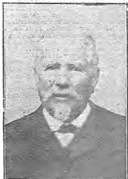
DON MANUEL MURGUÍA, ILUSTRE HISTORIADOR DE GALICIA, ESPOSO DE LA INMORTAL POETISA DOÑA ROSALÍA DE CASTRO, PRESIDENTE DE LA VELADA EN HONOR DE CURROS ENRÍQUEZ

El caballero, dueño de los 1.500 duros, quiso recompensar á la señora con un billete de 25 pesetas, negándose en absoluto á tomarlo la interesada.