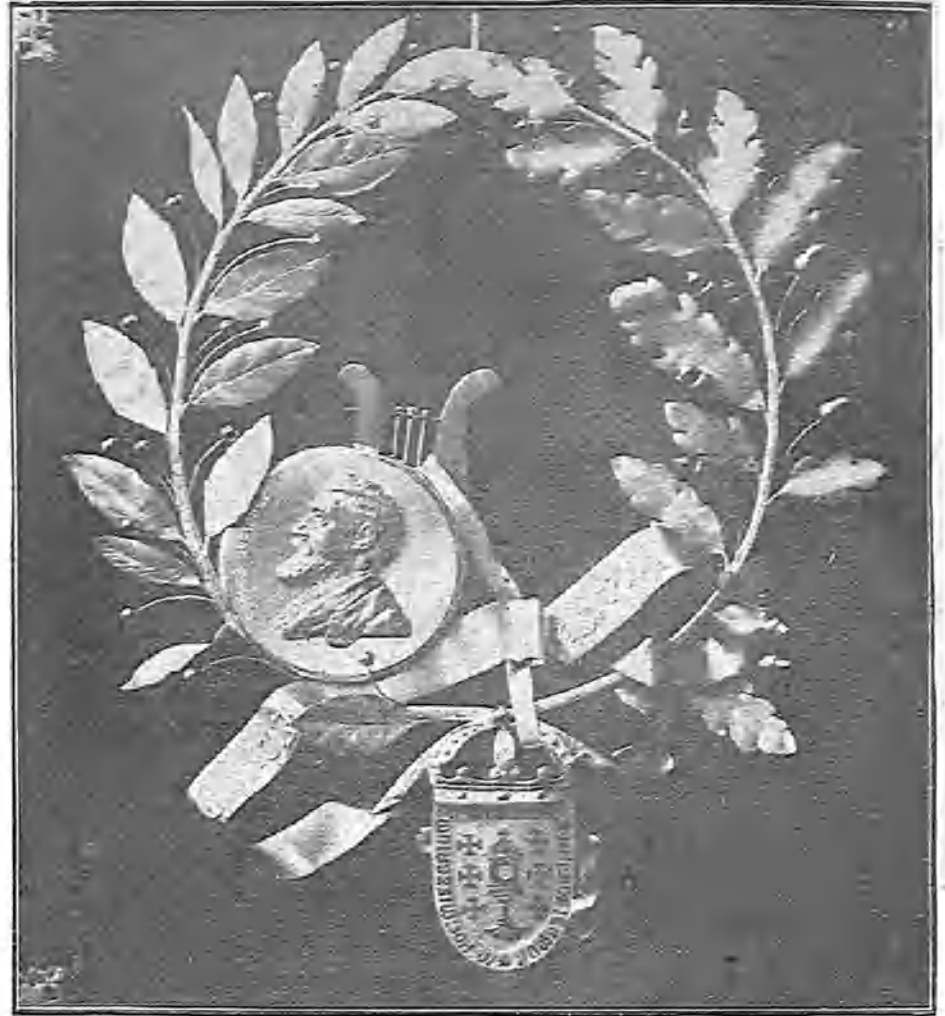
RONA DE ORO Y PLATA OFRECIDA AL POETA EN LA VELADA QUE SE CELEBRÓ EN LA CORUÑA

En la noche del 21 se celebró en el teatro Principal de La Coruña la velada en honor del insigne poeta gallego Curros Enríquez.