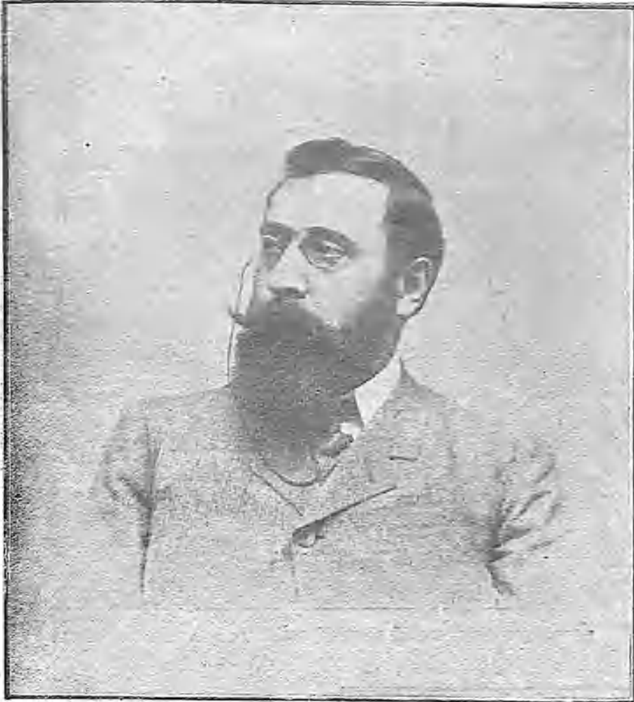
EL LAUREADO POETA Y NOTABLE PERIODISTA GALLEGO D. MANUEL CURROS ENRÍQUEZ