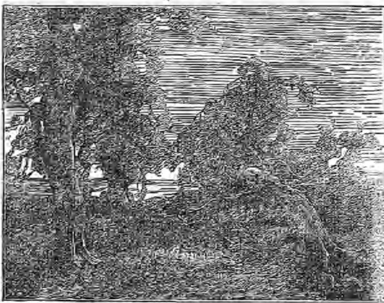
La muerte de una encina. (Cuadro de M. Lansyer.)

Esta fué agradaabilísima, tanto por la amabilidad de la anfitriona, como por los mil atractivos que supo prestarle, y la asistencia de bellas señoras y elegantes caballeros, los cuales no se retiraron