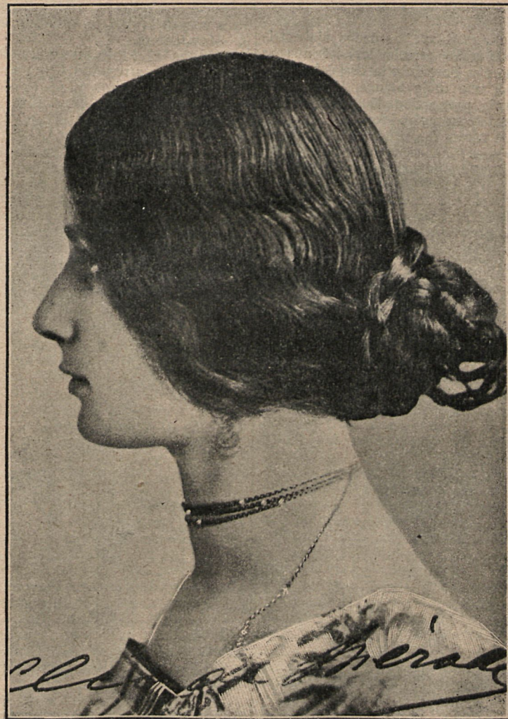
Cleo de Merode con el misterioso peinado que hace poner en duda la existencia de sus orejas.

INTERVIÚ DE LA ARTISTA CON UNO DE NUESTROS REDACTORES