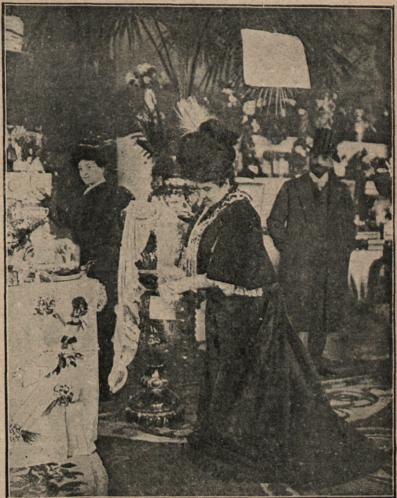
La marquesa de Squilache y la condesa de San Luis terminando los preparativos para el acto inaugural.

á treinta centímetros una de otra, la bala metálica dejará un agujero en cada una, y la de papel las romperá y retorcerá todas de tal manera que será imposible volver á usarlas.