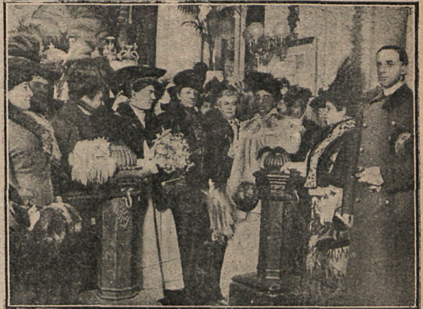
La real familia inaugurando la tómbola en la tarde de anteayer.