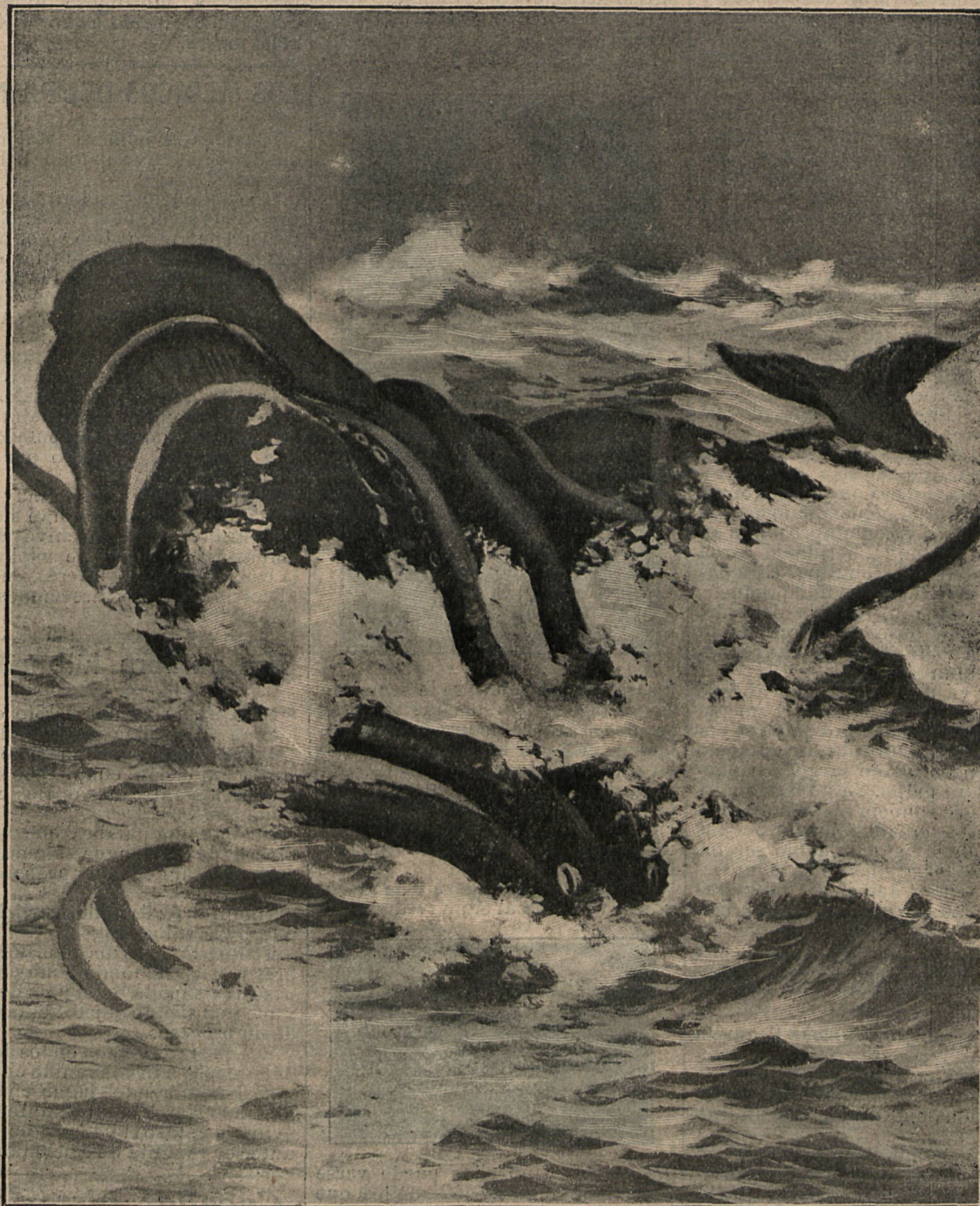
El pulpo y la ballena sosteniendo su terrible lucha.