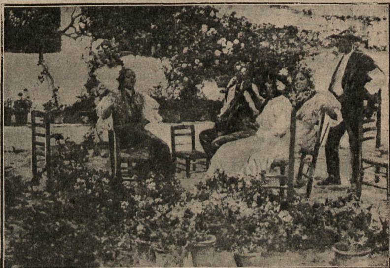
«Una copla», cuadro de Ruiz Guerrero.

Acercóse á él el rey, chocándole la marcialidad y buen aspecto del soldado, y le dirigió las tres pre-