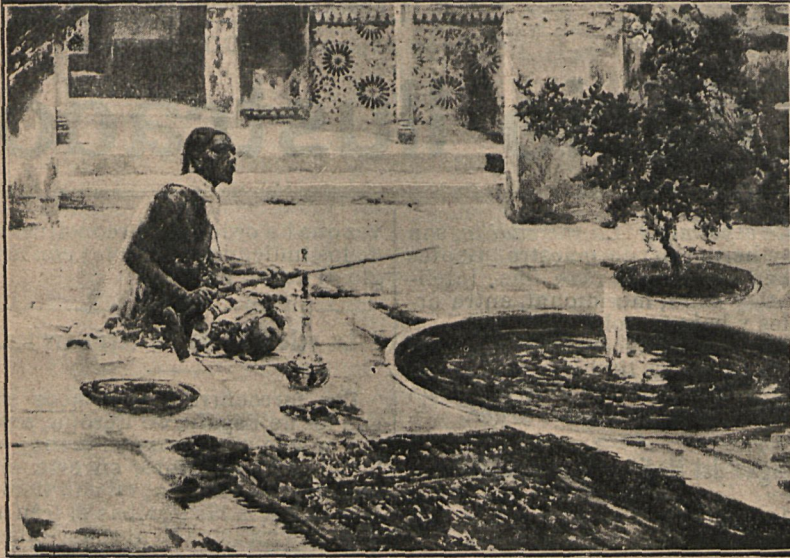
«Un patio árabe», cuadro de Ruiz Guerrero.

guntas de ordenanza, pero invirtiendo su orden acostumbrado, que es como las había aprendido el francés para cuando Federico se las dirigiera.