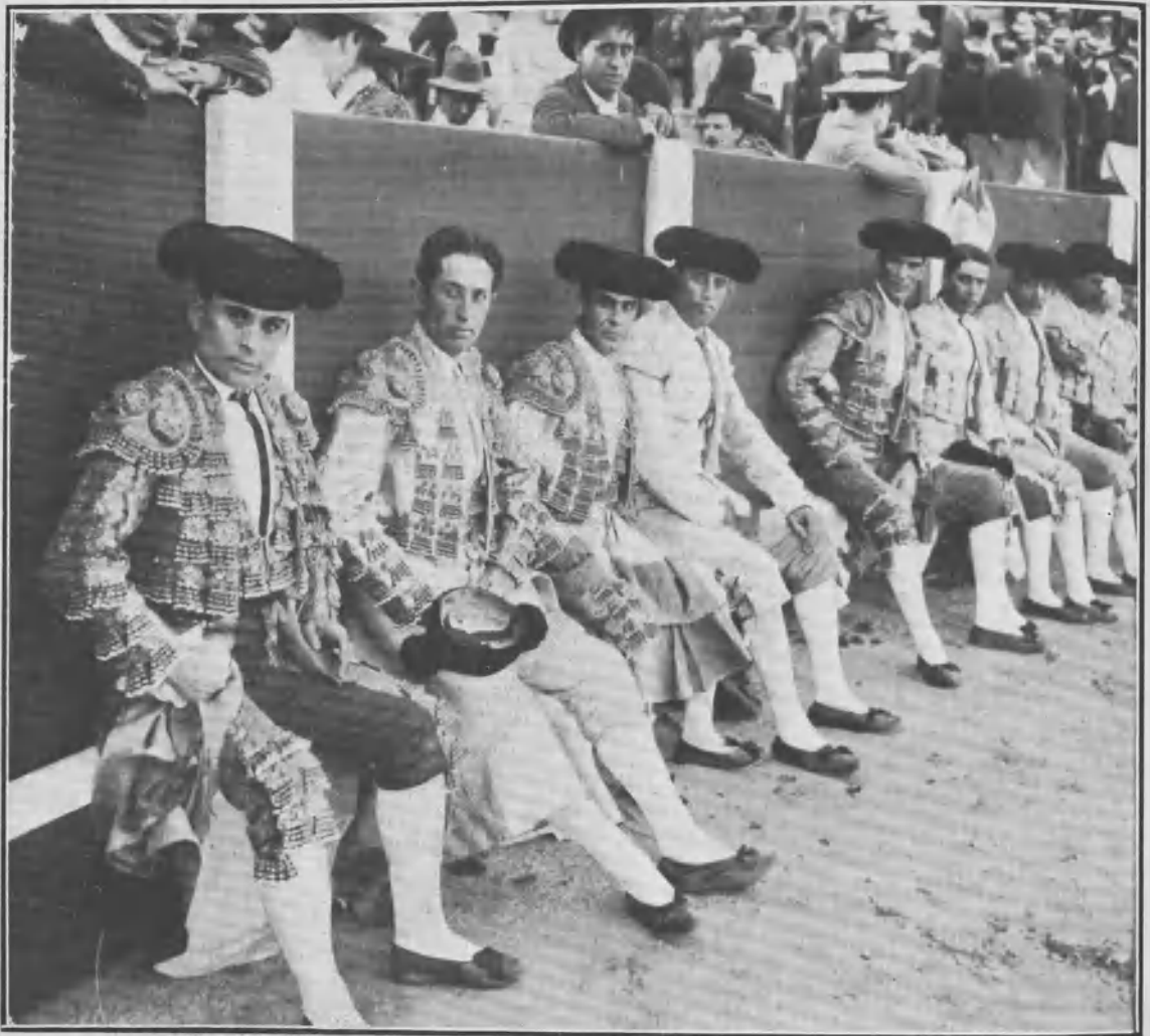
Las cuadrillas descansando en el estribo.