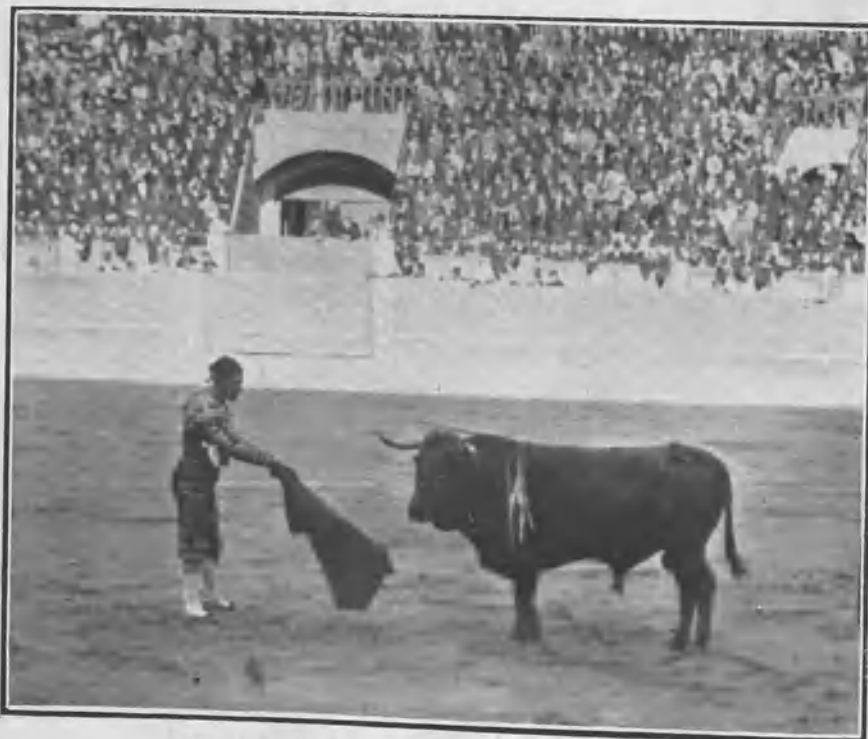
«Matapozuelos» presentando la muleta á su primero.

El primer espada era en esta lidia el madrileño Juan Cecilio, quien por el percance ocurrido en el sexto á su compañero Celita tuvo que matar tres toros, debido á esta circunstancia el haber quedado bien ante el público, pues por lo que había hecho con sus dos primeros era cosa de pedir que no viniera en unos cuantos meses.