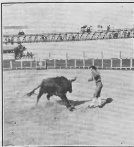
«Corchaito» á la salida de un par.