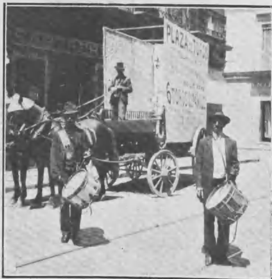
Como anuncian las corridas en Montevideo.