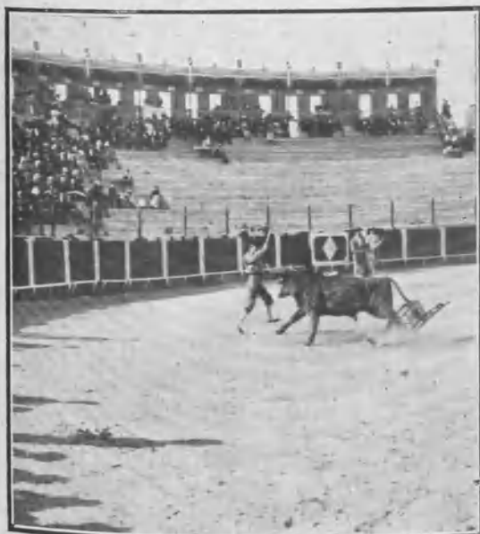
«Corchaito» en banderillas.

El público salió más satisfecho que de ninguna fiesta de esta temporada, y también debieron quedarle la Empresa y los lidiadores. Un buen día.