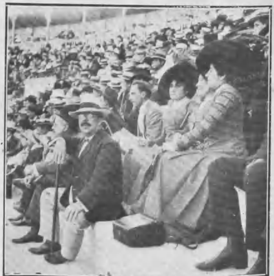
Un tendido de sombra.