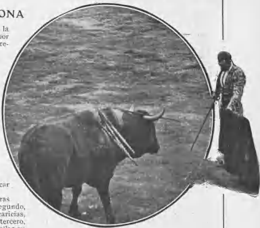
GUERRERITO PASANDO DE MULETA

La plaza, pese también á los abolicionistas, estuvo casi totalmente llena, y el público salió, por lo general, complacido del conjunto de la corrida, en la que hubo de todo.