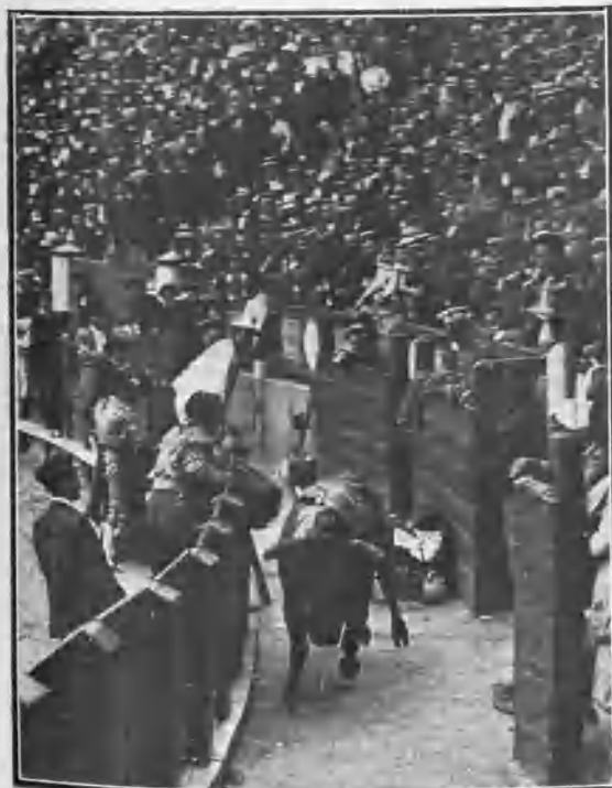
UN TORO EN EL CALLEJÓN

Y en vista de la gran entrada que hubo en esta corrida, se nos ocurre decir: Si ahora salieran dos ó tres toreros que empujaran como en pasados lustros empujaron otros, habría necesidad de agrandar la plaza y doblar el número de localidades, que estarían ocupadas todos los días de corrida.