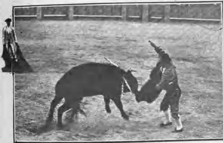
CARABANCHEL. ALVARADITO EN EL MOMENTO DE DAR UNA ESTOCADA