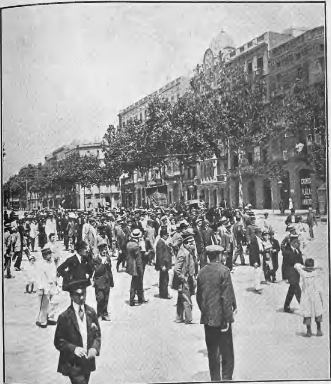
ASPECTO DE LA RIDÍCULA MANIFESTACIÓN ANTITAUROFÓBICA POR EL PASEO DE SAN JUAN

El domingo se celebró en Barcelona la cacareada manifestación contra las corridas de toros, á la que sin duda pensaban los organizadores que, por ser día de asueto, acudirían muchos curiosos que podían tomarse por manifestantes. No estaba mal pensada la triquiñuela, y si hubiera resultado, como pudo resultar, hoy se pavonea-