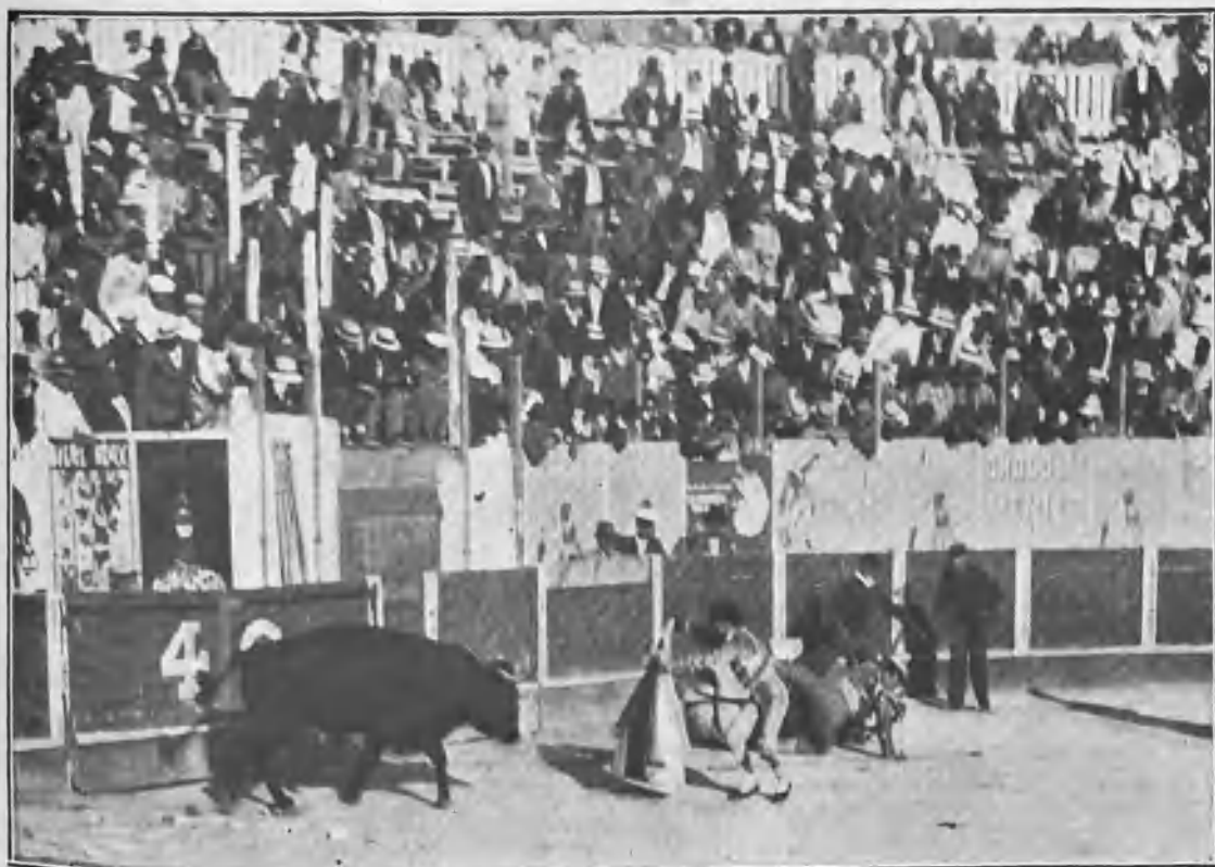
UNA CAÍDA DE MELONES CHICO Y RELAMPAGUITO AL QUITE

Se dice que los han contratado para el año próximo.