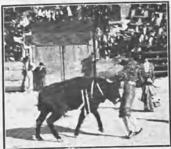
VALLECAS. COGIDA DE SOTILLO