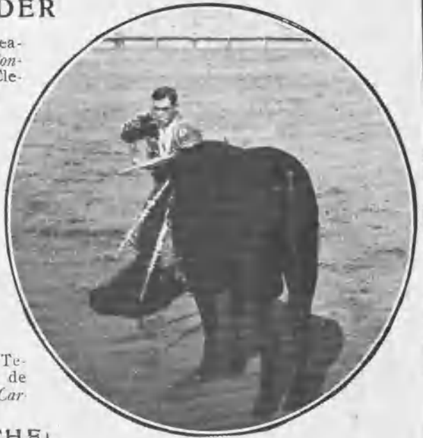
SANTANDER. MATAPOZUELOS ENTRANDO Á MATAR

Paco el Gordo , Carbonero y Algeteño mataron en Tetuán toros de Arribas, que pueden llamarse de abajos , porque no son los arribeños andaluces. El Car-