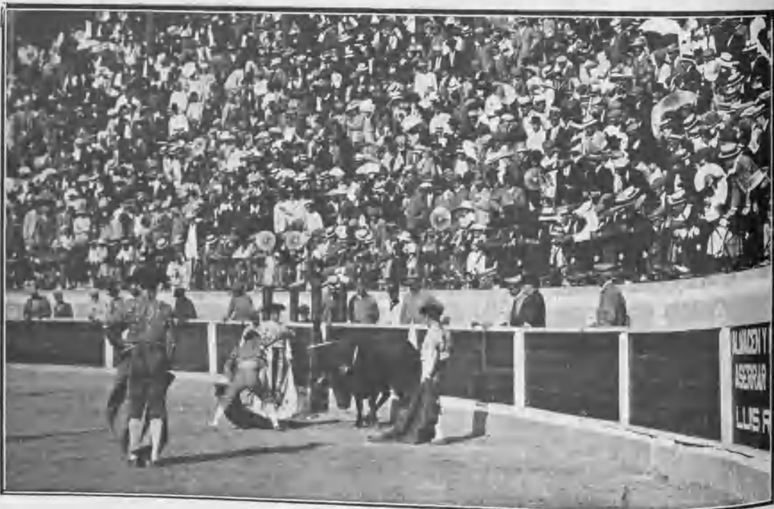
PUNTERET DESCABELLANDO Á SU PRIMER TORO

El público quedó muy satisfecho del trabajo de los matadores que, como queda dicho, hicieron cuanto estaba de su parte para quedar bien y lograr nuevo contrato para el año próximo ó antes si antes se organizaran fiestas de novillos en La Línea .