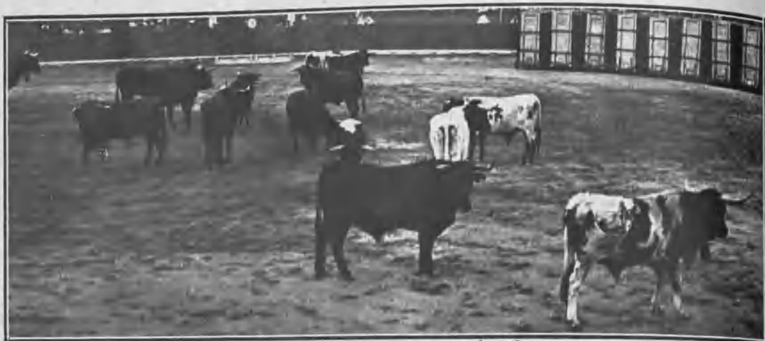
LOS MANSOS ENVOLVIENDO Á UN TORO PARA LLEVARLO Á LOS CORRALES

En las célebres fiestas de Valencia es siempre un número simpático y de gran animación el desencajonamiento de los toros para las cuatro corridas de feria en el redondel de la hermosa plaza de aquella capital.