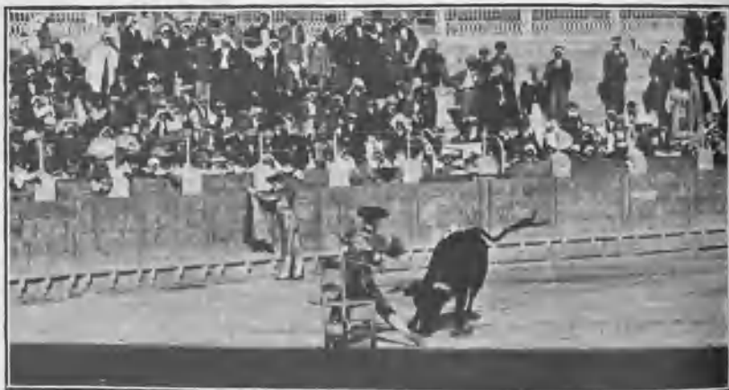
ESPARTERET CAMBIANDO BANDERILLAS EN SILLA

En su toro primero estuvo valiente al torear de muleta, y en cuanto sujetó al de Carreros dió un buen pinchazo, al que siguió una corta delantera que no