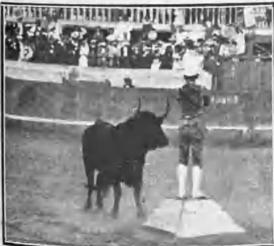
TETUÁN. GONZALITO EN LA SUERTE DEL PEDESTAL