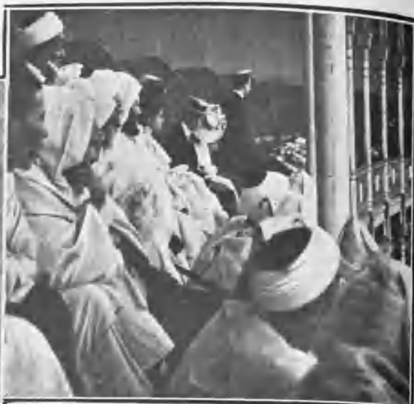
LA EMBAJADA MORA PRESENCIANDO LA NOVILLADA

LA AFICION NO DECAE Sabía el público que no iban á ser bravos los toros de Veragua, y que aunque pasieran mucha voluntad los muchachos no eclipsarian glorias legítimas; pero esto no obstante, con un calor senegalesco, se vieron ocupados tendidos, gradas y andanadas.