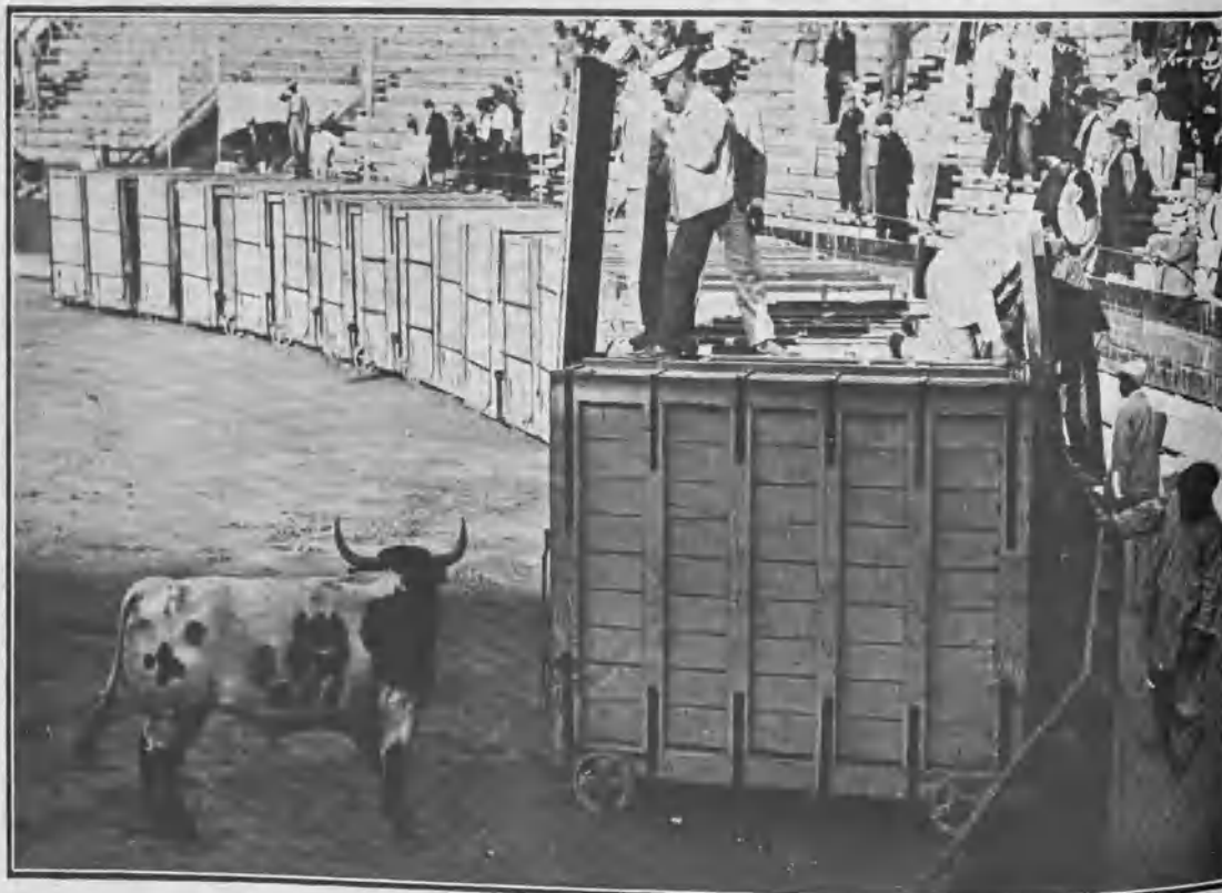
DESENCAJONAMIENTO DE UN TORO

El desencajonamiento resultó una fiesta muy animada y sin incidentes lamentables. Uno de los toros se empeñaba en extraviarse, pero los buenos oficios del cabestrage lo contuvieron.