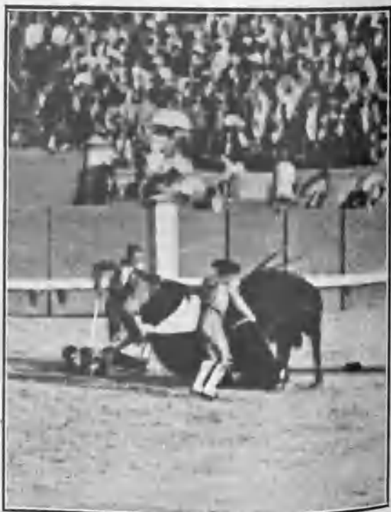
COGIDA DE PUNTERET

Entra derecho á matar algunas veces, y con