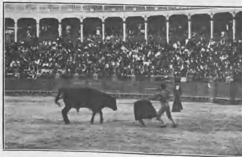
GORDET TIRÁNDOSE Á MATAR EN EL CUARTO NOVILLO