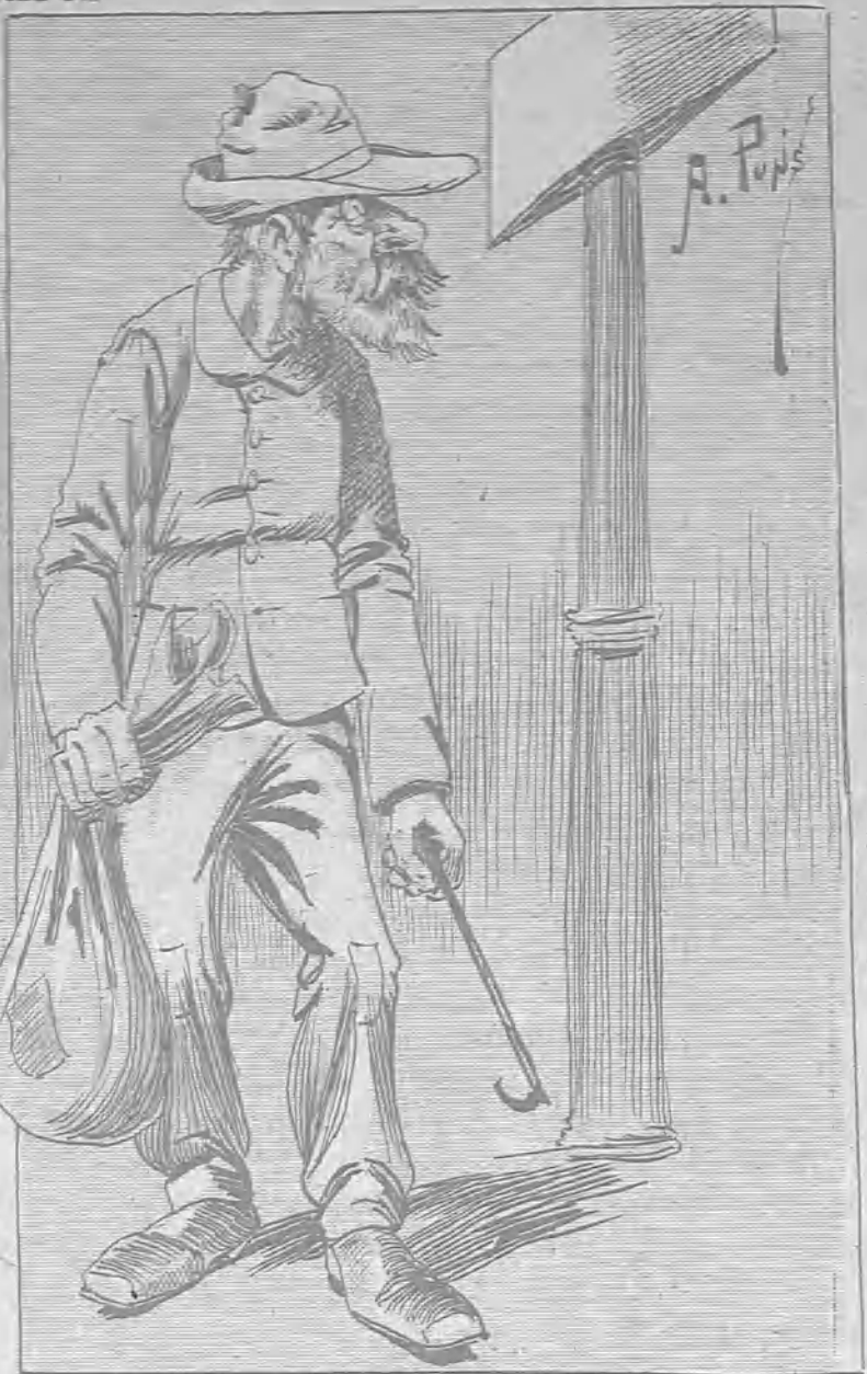
CELOS DE CLASE

—¿Dices que no has conocido á tu padre? Dime, dime, ¿se llamaba Restituta tu madre?