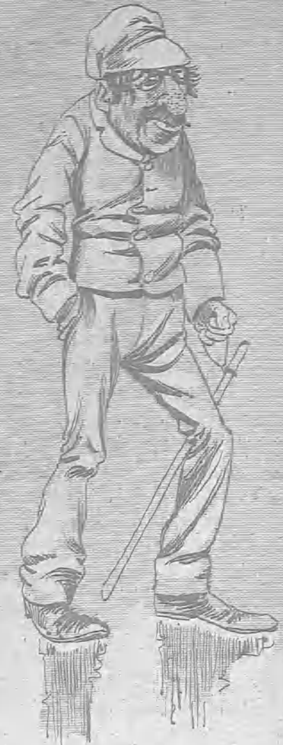
—Tié que ver que el Pipi venga poniéndose moños porque ha estado seis años en Cental! ¡Mía que á mí que me he pasado toa la vida en mis posesiones de Africa!