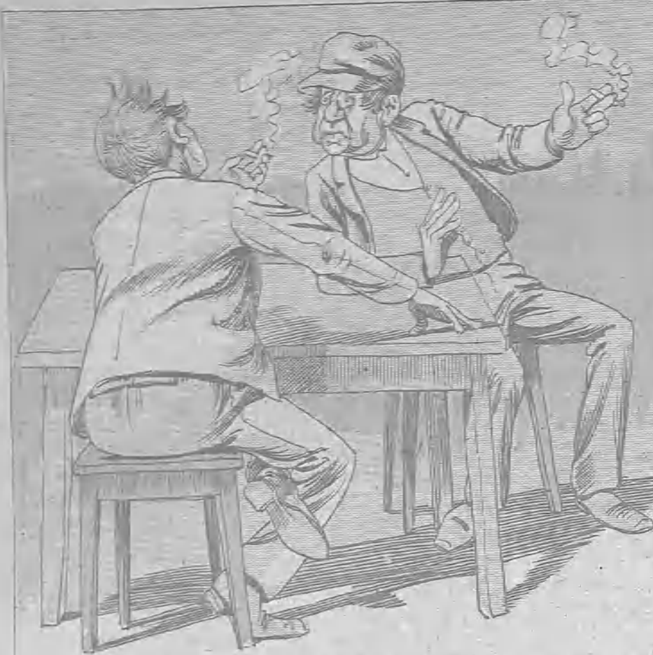
—Yo lo que te digo es que en cuanto que guipa á tu mujer, le doy una patiza que yo entiendo; porque pá que tú lo sepas, nos está engañando.