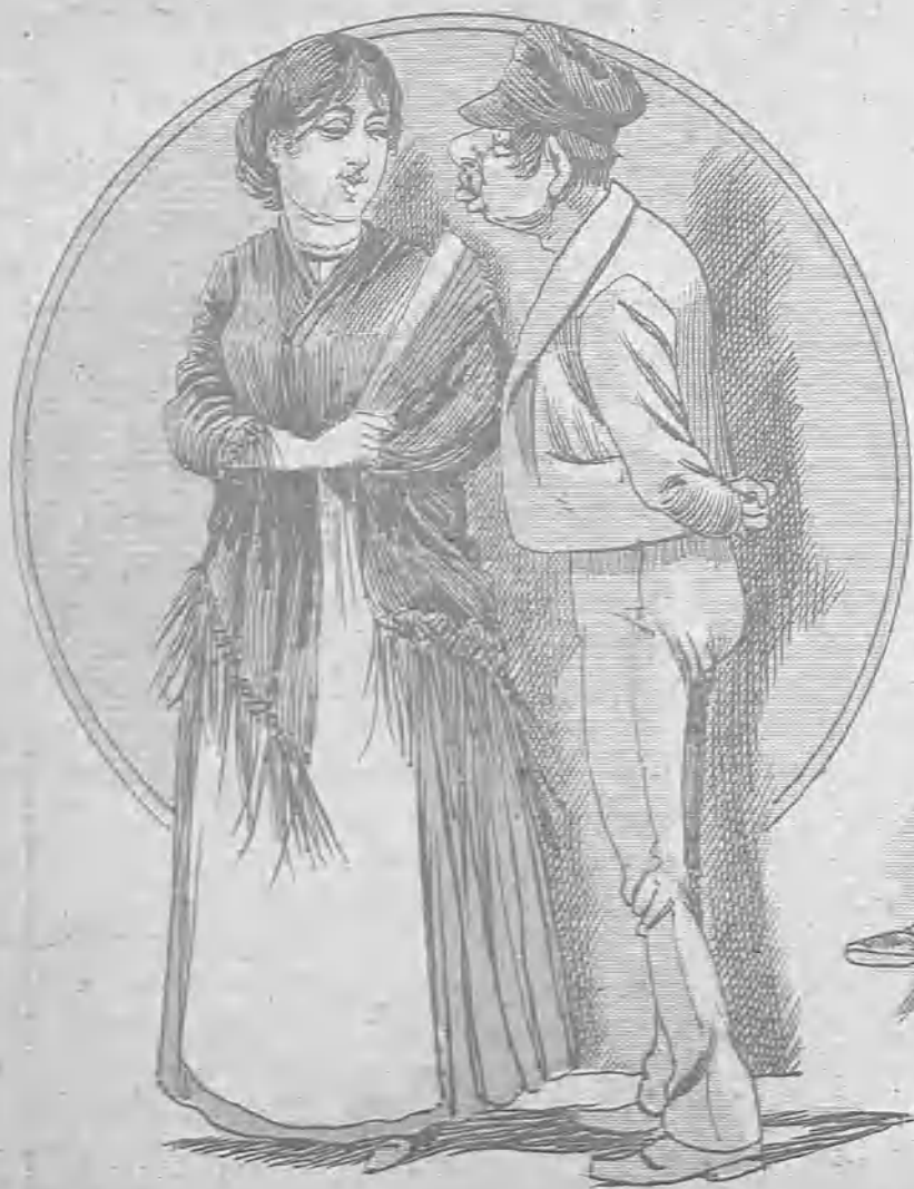
—Mira, casarnos no, que eso es má mal visto; pero lo que podemos hacer es una liga, como los políticos, y enligarnos.