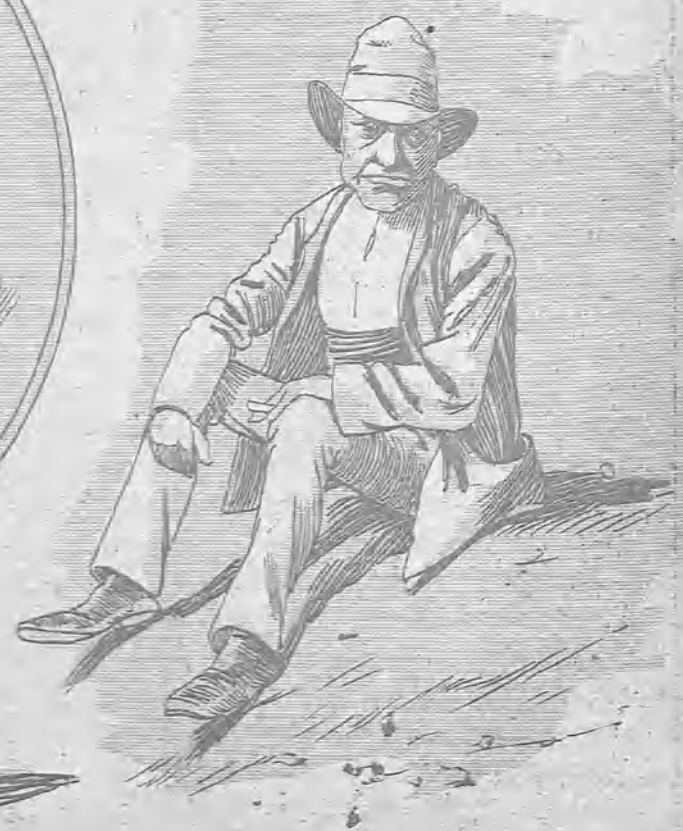
—Siento yo así como si el cuerpo me pidiera media docena más de copas de lo triple. ¡Y cuando el cuerpo lo pidet!