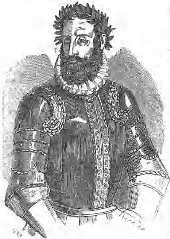
(Luís de Camoens.)