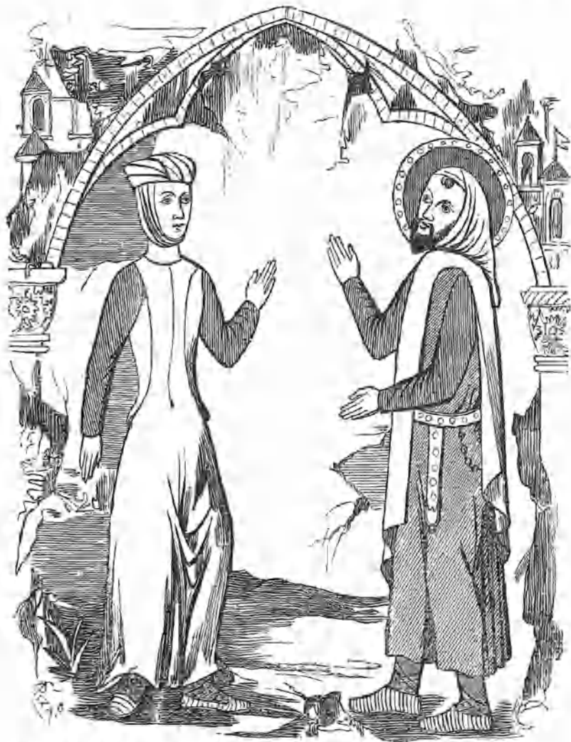
(San Isidro Labrador y Sta. Maria de la Cabeza, pinturas existentes en su oratorio.)

La tradicion tambien ha señalado hasta nuestros tiempos el paso del piadoso madrileño en otros sitios de esta villa y sus contornos, ya en lo que hoy es su calle mayor y entonces era estramuros de la puerta de Guadalajara, donde habia hasta hace pocos años un trozo de soportales llamados aun de S. Isidro, que se han derribado. Allí se encontraba un pozo milagroso abierto segun tradicion por el Santo, y otro en una casa de la calle de los Estudios contigua al colegio imperial. Tambien se señala generalmente el sitio que ocupa hoy á la orilla opuesta del Manzanares la famosa ermita que visita este dia toda la