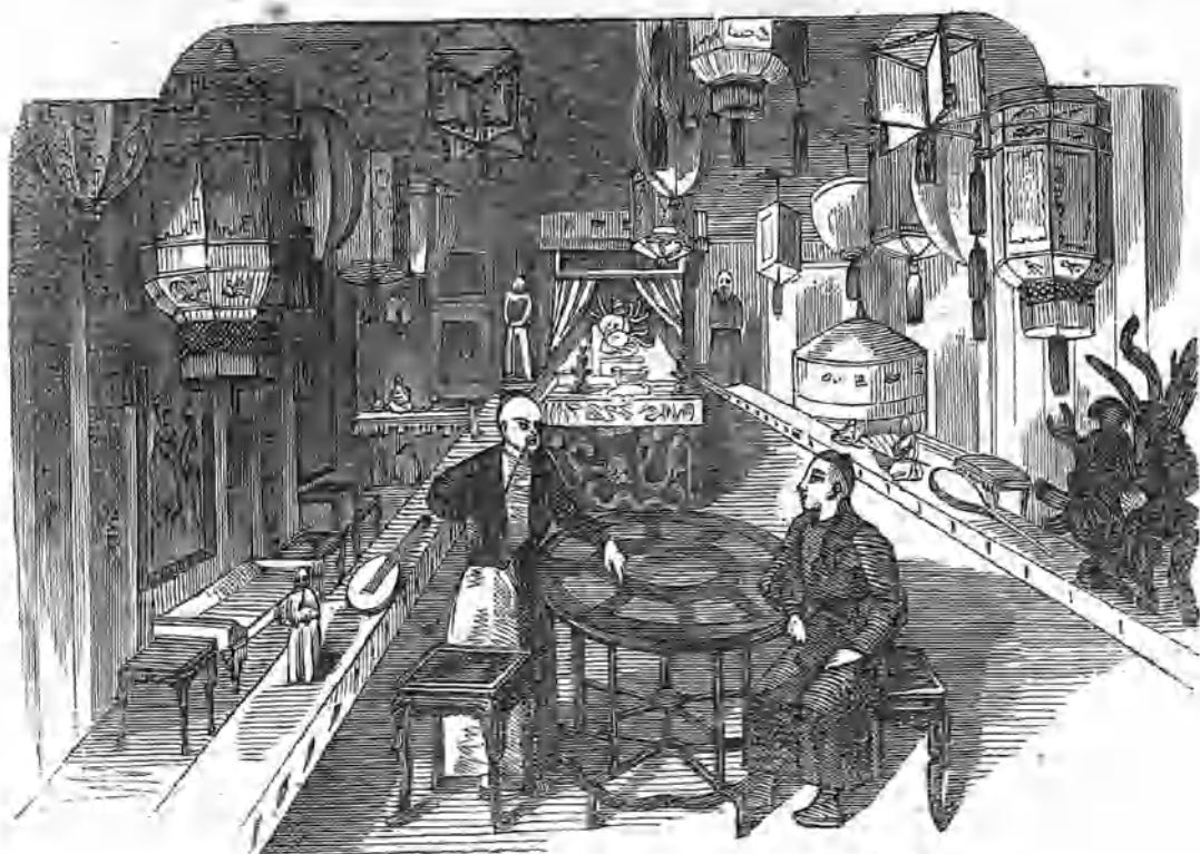
(Cámara principal del Duque de Oporto.—Véanse los n.ºs. 40, 47 y 48.)