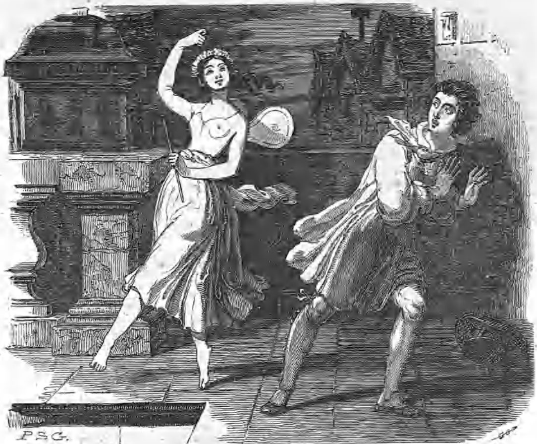
LA SOMBRA DE APRIGNY.