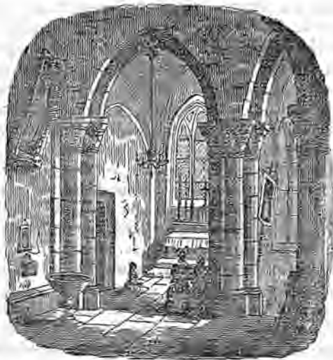
ANTIGÜEDADES DE LUGO.