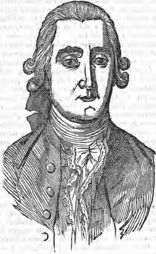
DON VICENTE GARCÍA DE LA HUERTA.

El descuido y abandono de los escritores en consignar las noticias históricas de los hombres distinguidos de su tiempo, es para los sucesores causa de justa reconvencción, sin hacerse cargo de que ellos mismos suelen usar con sus contemporáneos de igual injusticia; que les será igualmente echada en cara por los que vendrán despues.