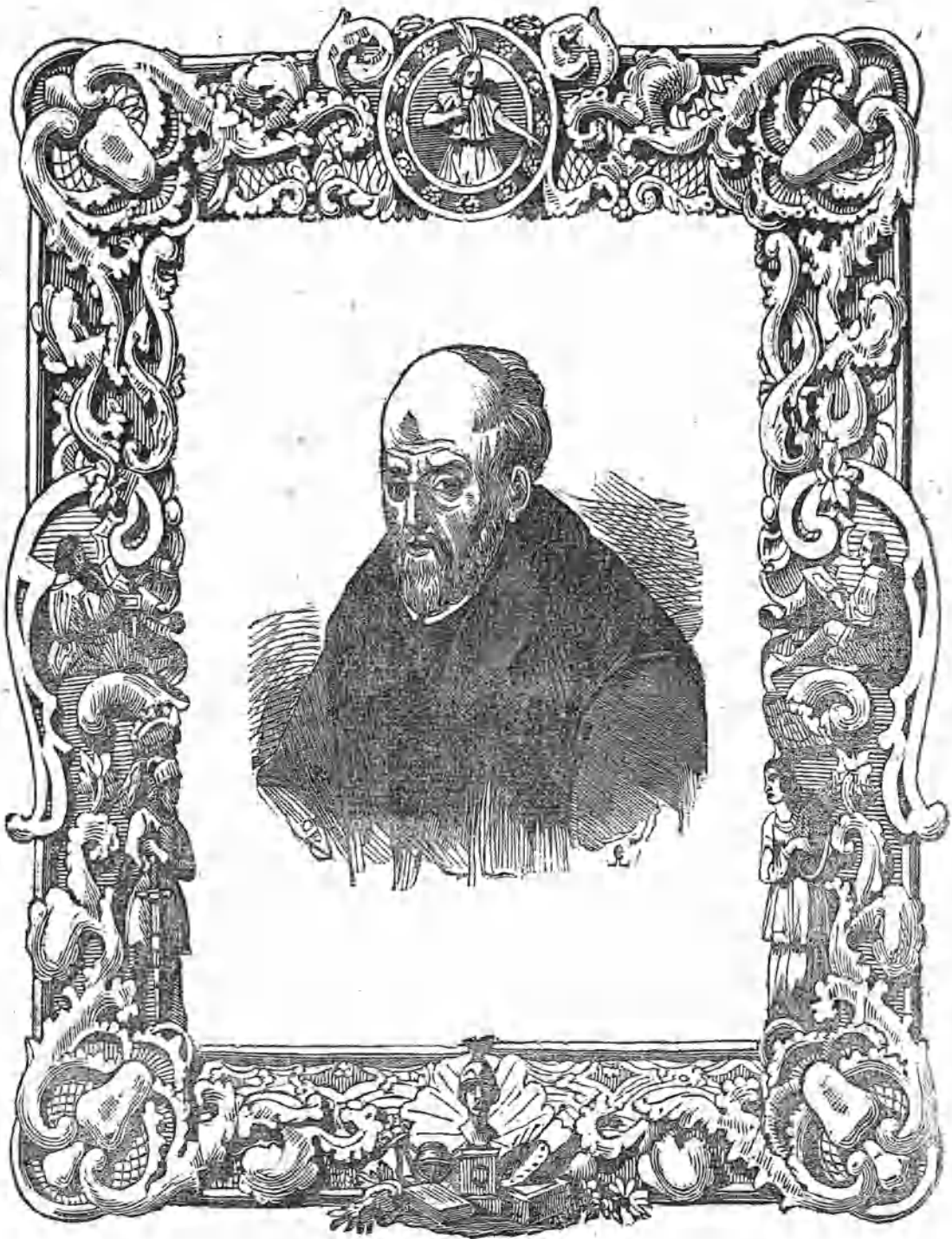
EL P. JUAN DE MARIANA.

S ENAS habrá español medianamente instruido y amante de las glorias de su patria, que no tenga noticia de este célebre escritor, que vinculó su nombre á la historia de su país, en una obra recomendable bajo todos aspectos, y que se pre-