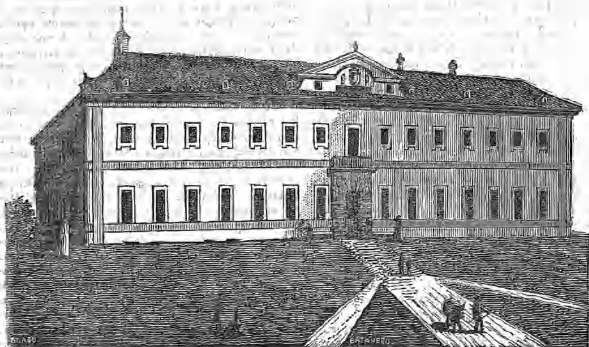
LA FÁBRICA DE ARMAS BLANCAS DE TOLEDO.

Desde los mas remotos tiempos de la antigüedad han florecido en Toledo las artes y maniobras indispensables para pasar la vida humana; pero aunque se pudiera fijar la época del primer establecimiento de muchas manufacturas, no así con la fábrica y gremio de armeros y espaderos de esa ciudad cuyo origen se pierde con el de su misma fundación, y en esta oscuridad y falta de documentos, solo podré dar algunas noticias que en las historias se encuentran repartidas. Bien notorio es lo que dice el poeta Gracío Falisco, autor que vivió en tiempo del famoso Ovidio, quien en el tratado de venatione vers. 341, dice « Ima toletano procingant ilia eultro » De este poeta hace mencion el mismo Ovidio en la última Epístola del Ponto ad invidum diciendo: Aptaque venanti Gratius arma daret Cervantes en su Quijote igualmente hace mencion de las espadas toledanas del perrillo, llamadas así, por usar de marca en ellas su forjador la figura de un perro.