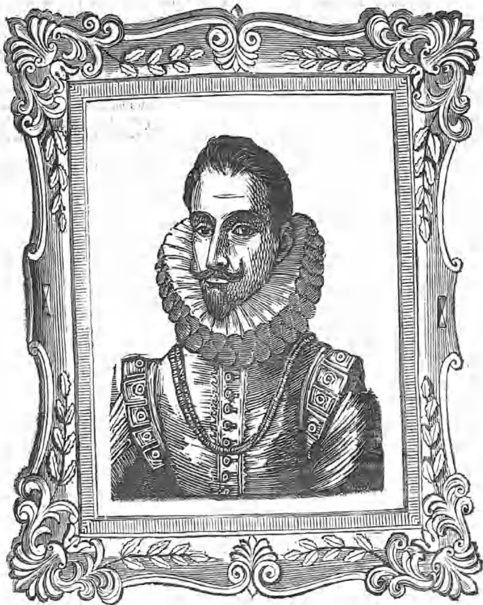
LOPE DE VEGA [1].

L ope Felix de Vega Carpio nació en Madrid, en la puerta de Guadalajara y casas de Gerónimo de Soto, en 25 de noviembre de 1565, y fué bautizado en la parroquia de San Miguel en 6 de diciembre siguiente. Fueron sus padres Felix de Vega y Francisca Fernandez,